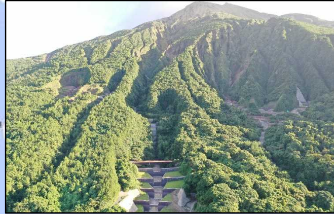
松浦川地区荒廃及び復旧状況