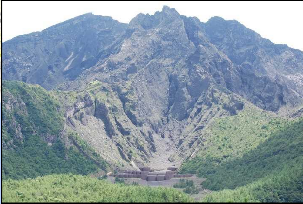
引の平沢地区荒廃及び復旧状況