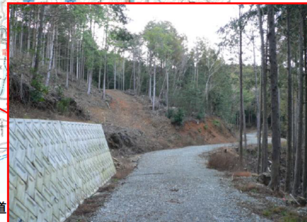
開設された林道と森林作業道