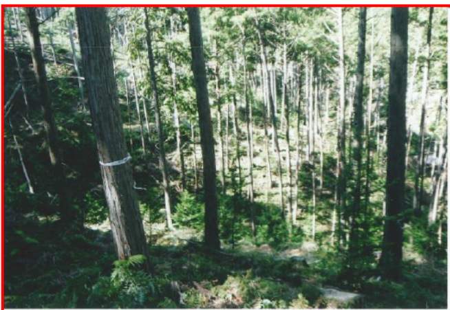
育成複層林造成による更新作業