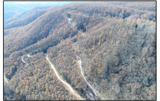
路網整備事業（新設工事）