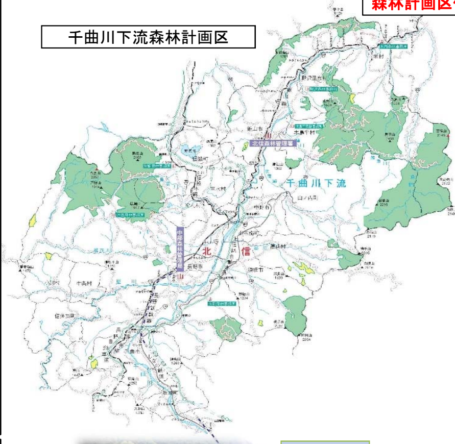
中部森林管理局管内 森林計画区位置図