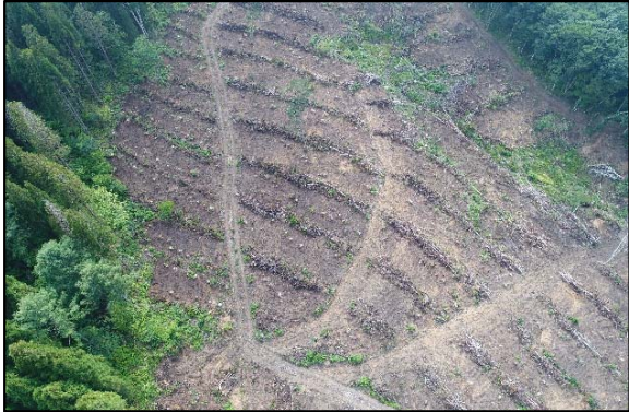
森林整備事業（地拵・植付）