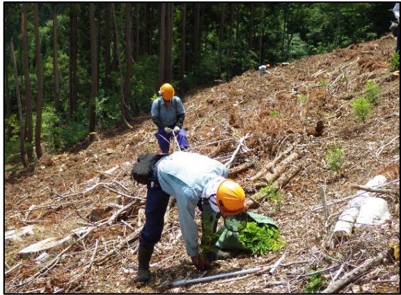
森林整備事業（間伐後）