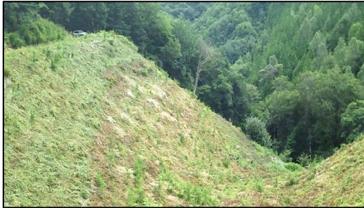
東信森林管理署 下刈