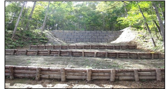
東信森林管理署 大門西林道改良工事