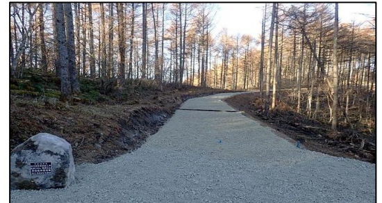
東信森林管理署 四方原林道新設工事