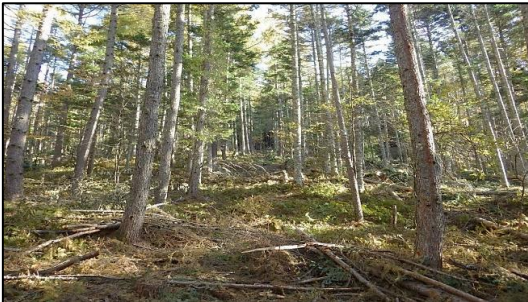
東信森林管理署 保育間伐