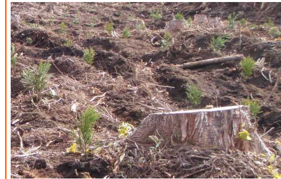
小屋沢山国有林（植付）