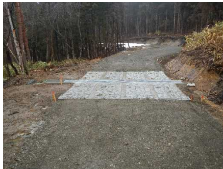
梁川山国有林（ケヨウシ林道（林業専用道））