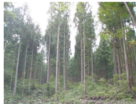
小屋沢国有林（保育間伐）