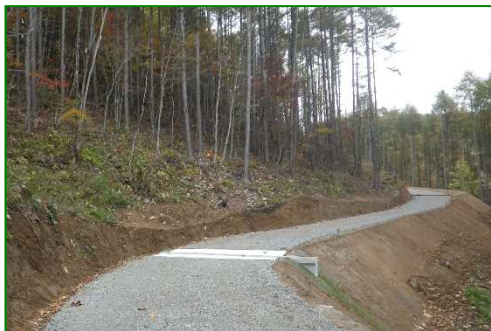
林道（林業専用道）新設