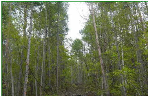
北田代山国有林（間伐）