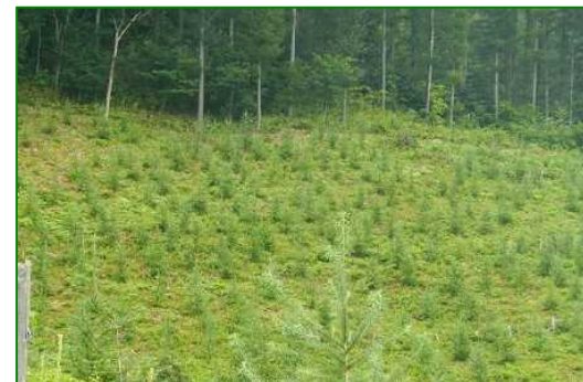
中居村国有林（下刈）