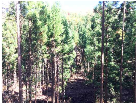
峠国有林 (保育間伐)