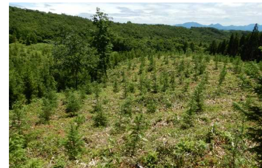
坂本山国有林 (下刈)