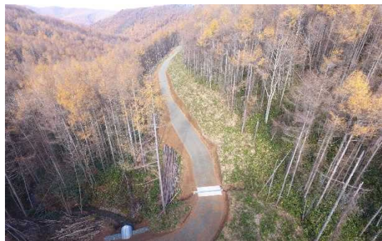
薮川(北の沢) 林道(林業専用道)