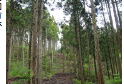
(高性能林業機械による間伐作業)