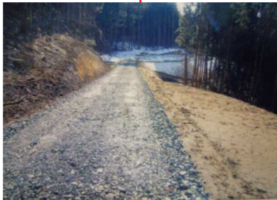
君田(小川)作業道 (平成20年度新設)