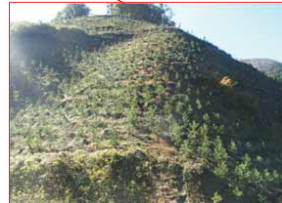
下刈作業 (多野郡神流町)