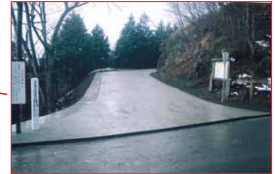
路網整備 (多野郡神流町)