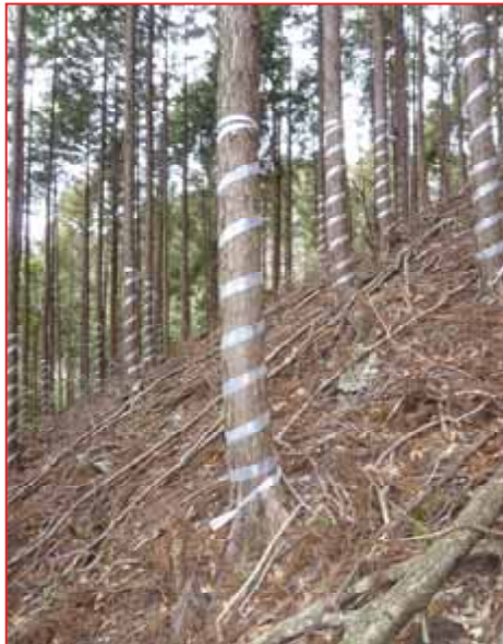
獣害防除 (多野郡上野村)