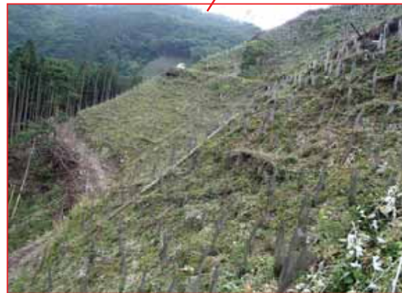
植付・獣害防除 (富岡市)