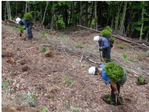
地拵・植付 (沼田市箕平国有林)