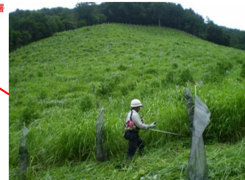
下刈 (沼田市小森国有林)