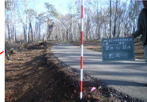
林業専用道新設 (沼田市迦葉山丙350/1国有林)