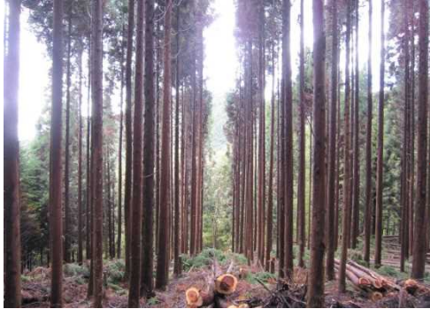
間伐 (みなかみ町大源田外2国有林)