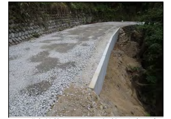
飛騨森林管理署 双六細越 改良工事