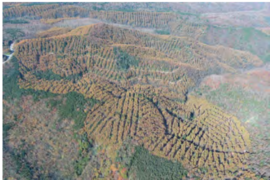
飛騨森林管理署 千間樽国有林 間伐