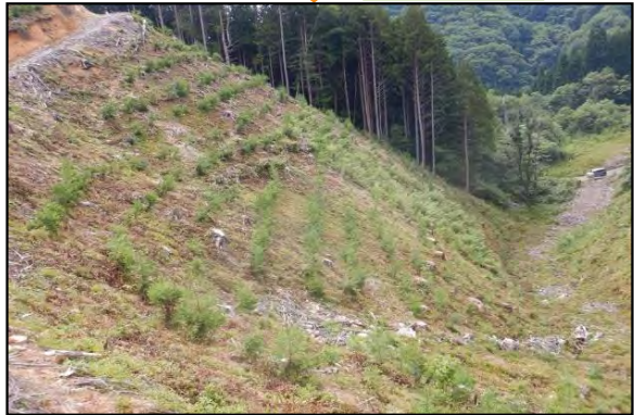
飛騨森林管理署 三尾山国有林