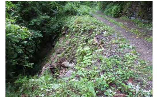
飛騨森林管理署 双六細越 改良工事