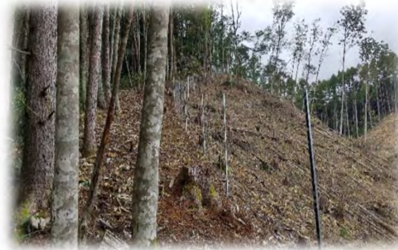
飛騨森林管理署 牛牧国有林