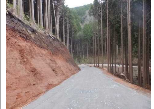
岐阜森林管理署 ミスリ林道 新設工事