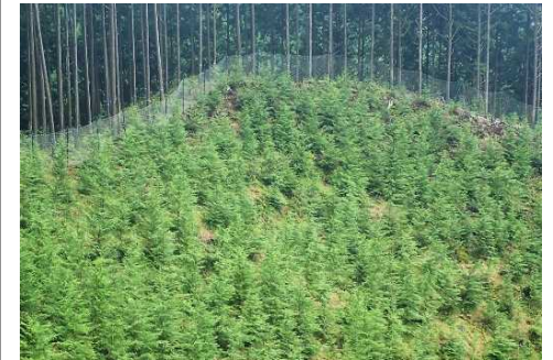
岐阜森林管理署 七宗1220林班