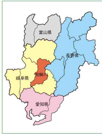
中部森林管理局管内 森林計画区位置図