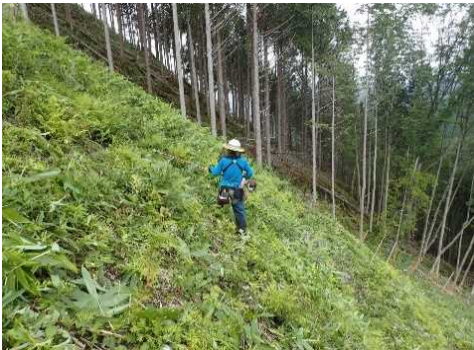
岐阜森林管理署 下刈