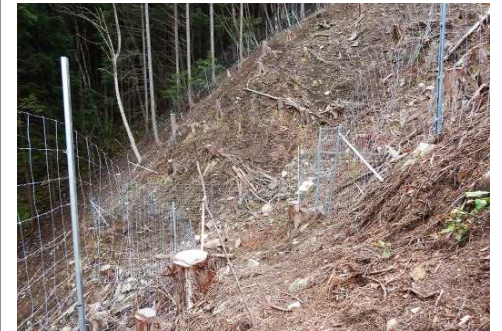
岐阜森林管理署 小川長洞1113林