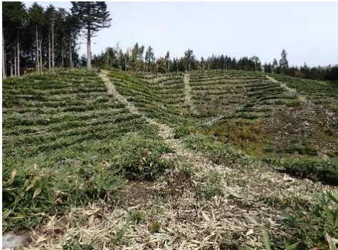
岐阜森林管理署 門坂1林班