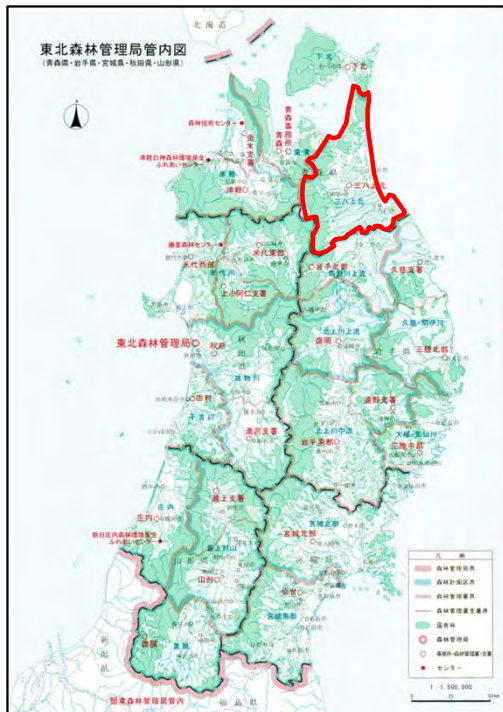
三八上北森林計画区位置図 (三八上北森林管理署)