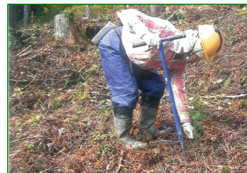
小田川山国有林（植付）