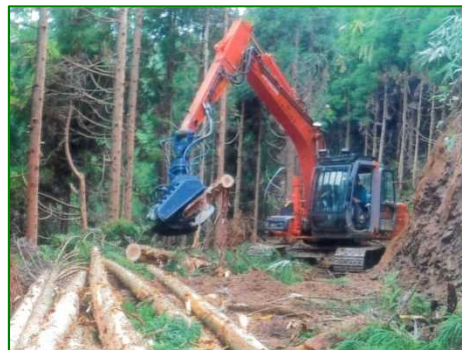
薄市山国有林（間伐）