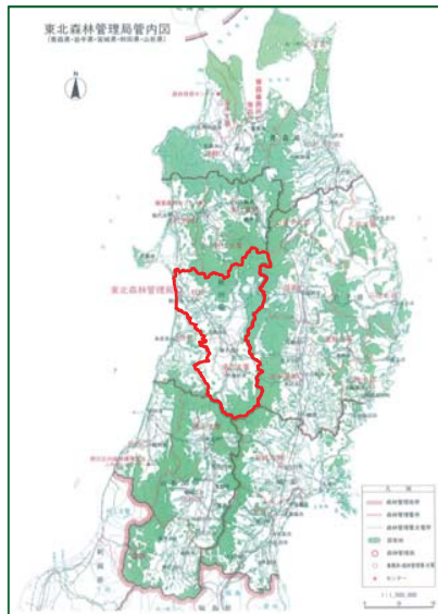
雄物川森林計画区位置図 (秋田森林管理署・秋田森林管理署湯沢支署)