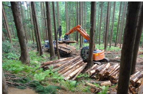
小阿仁奥山国有林 (保育間伐)