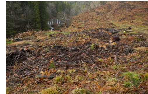
早瀬沢外7国有林 (植付)