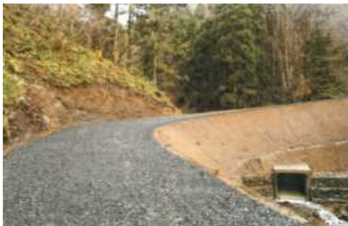
小沢田外7国有林 (中茂林道開設)