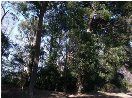
シラカシを優占種とした境内林(さいたま市)