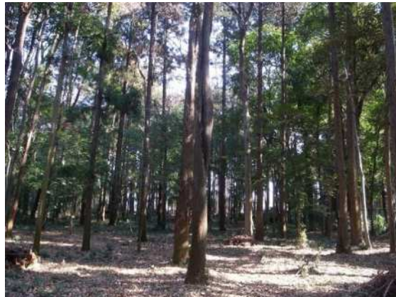
スギ、ケヤキ、シラカシ優占の屋敷林(桶川市)