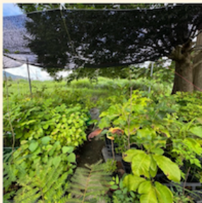
地域性広葉樹苗木