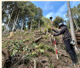
植栽位置を決め、杭打設、GNSS測量