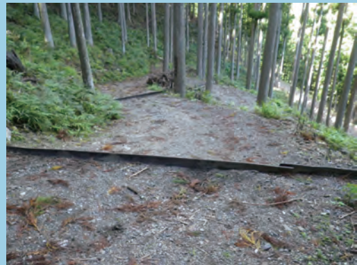
ゴム板を利用する (撮影場所 奈良県)