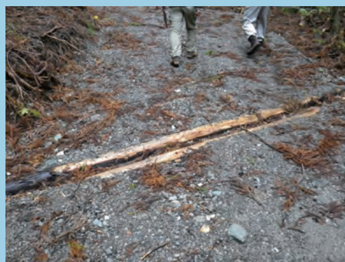
丸太2本を使用し、間を流す (撮影場所 静岡県)