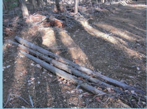
素掘りの後、洗掘防止の為に丸太を敷く (撮影場所 岡山県)