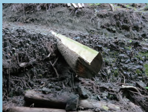
V字カットした丸太を埋める (撮影場所 福岡県)