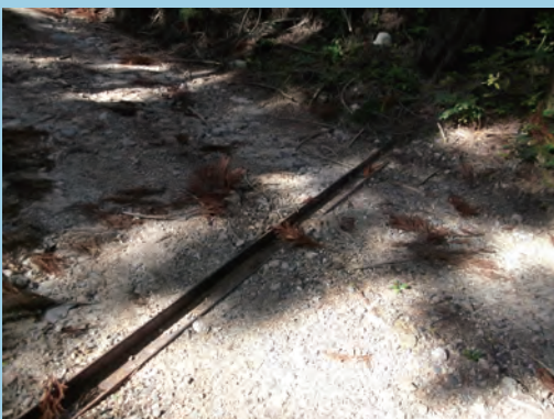
H形鋼を利用する (撮影場所 広島県)