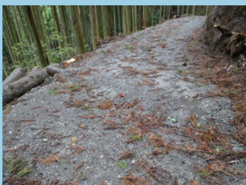
丸太1本を敷き、土盛りをする (撮影場所 静岡県)