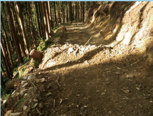
土盛り（「のっこし」と呼ばれる）をする (撮影場所 徳島県)