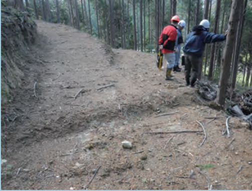
重機のバケットで素掘りをする (撮影場所 岡山県)