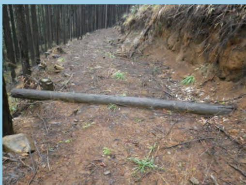
維持管理として、丸太1本を使用する (撮影場所 静岡県)

日本の地形や、地質・土質は複雑で、気象条件も多様です。地域に合った創意工夫を行うことが大切です。