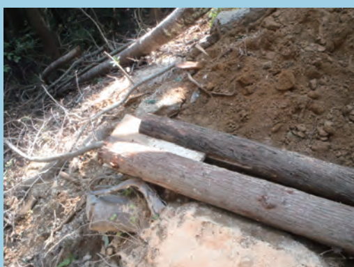
板を挟み、のり面への直接流下を防ぐ (撮影場所 鹿児島県)