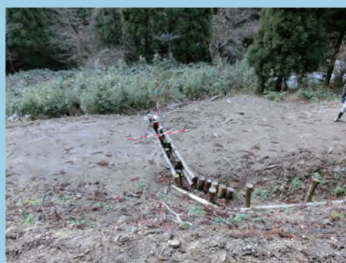
湧水地対策として深い溝を設ける (撮影場所 島根県)