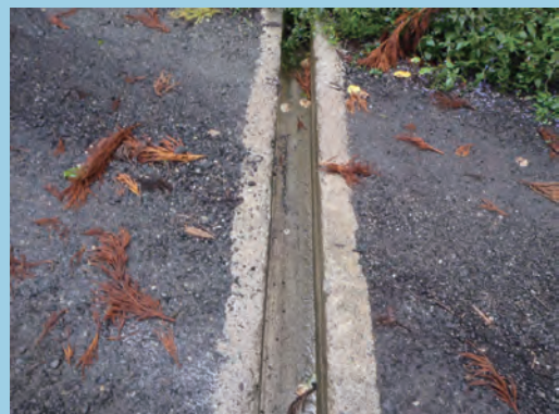
コンクリートを打設する (撮影場所 広島県)