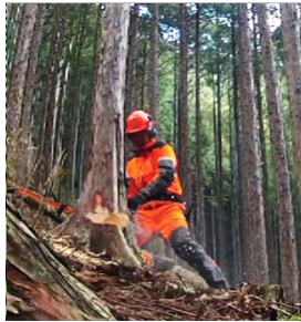
伐倒: チェーンソー