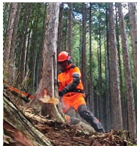
伐倒: チェーンソー