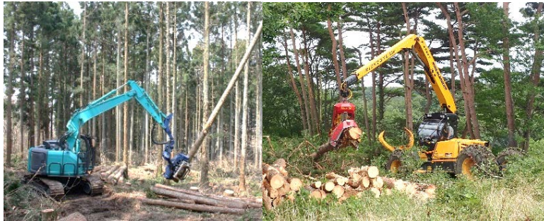
伐倒・造材: ハーベスタ