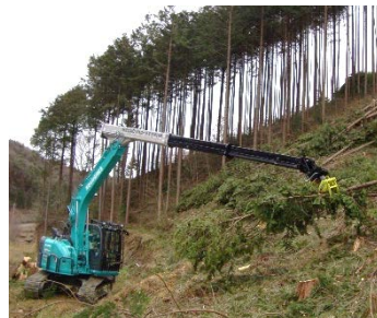
木寄せ: グラップル