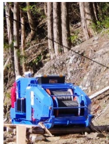
集材: 集材機、タワーヤード、スイングヤード