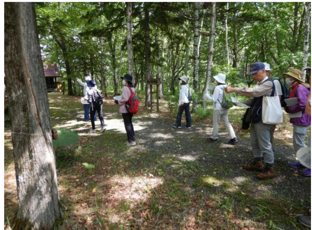
▽樹木見本園内の散策