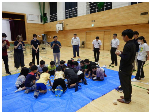
▽カルタとりの様子

児童生徒からは、「面白かった。楽しい。」「またしてみたい。」などの感想がありました。研修生も「貴重な経験をさせてもらって良かった。」と言っていました。