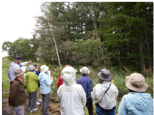
▽防風保安林見学の様子

次に、当センター所長から、「今年度の活動は、2月の来年度の計画を決める会を残すのみで、雷別地区自然再生事業地での植樹や自然観察など多くの会員の方にご参加いただきました。感謝申し上げます。