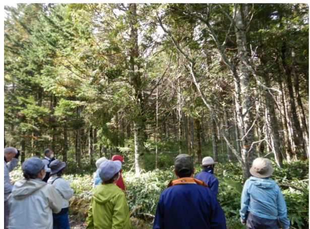
▽間伐実行済み箇所の見学