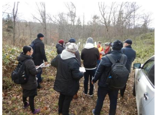
▽自然再生事業地の概要説明

当地区は、釧路湿原の源流部に位置し、自然環境の維持・保全を図る上で重要な場所であること。林齢70年以上の高齢の針葉樹（トドマツ）の人工林が広がっていましたが、平成12年の気象害（厳寒少雪