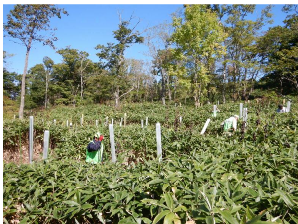
▽植栽木に保護管を設置する様子