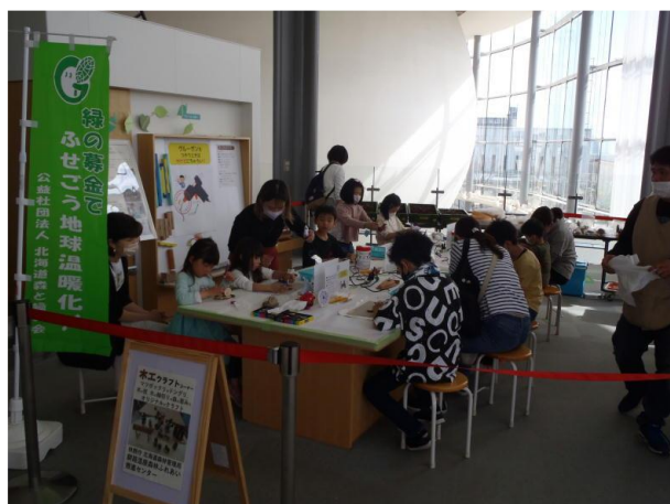
▽木工クラフトづくり会場の様子

当日は、小さなお子さんや大人の方も熱中して木工クラフトを楽しんでおり、見事な作品や個性的な作品等を作られている姿が見られました。参加者の方々からは「おもしろい！」「かわいい！」「また来てつくりたい！」「楽しかった！」等の嬉しい声が飛び交っていました。