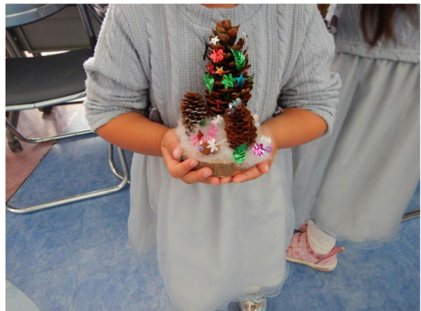
▽ミニツリーの力作