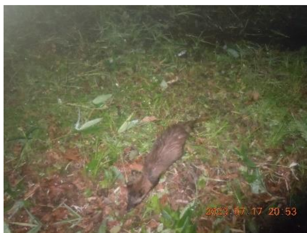
▽エゾタヌキ(R5.7 雷別 P5)