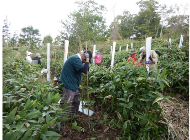
▽植栽木に保護管を設置する様子

森林づくり活動後には、当センター所長から、「植樹は、地球温暖化防止、SDGsの観点から大変意義のある活動であり、皆さんの貢献により植えられた樹木が順調に生長しております。誠にありがとうございます。」等の挨拶があり、皆さん充実した表情で会場を後にし、帰路につきました。