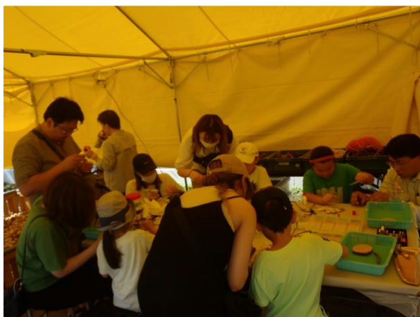
▽木工クラフトづくりの様子

当日は、この時期としては暑く、日差しが強く真夏を感じさせる天気でしたが、親子と一緒に木工クラフトに取り組む姿や子どもたちの仲間どうし、友だちと一緒に作る様子が見られる等、大盛況となりました。当センターのブースに訪れた皆さんの笑顔が印象に残る一日となりました。来年も是非協力していきたいと思えます。