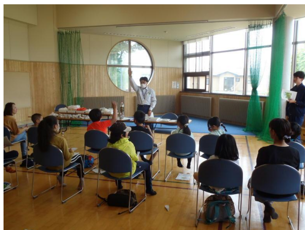
▽森林の役割・働き説明

次に、森林の水源かん養機能として、分かり易い図解のマンガで、森林が水を蓄える機能があるのと同時に土砂の崩壊を防止すること、緑のダムとなって徐々に河川に水が流れていくので、乾季が続かない限り、川にはいつも水が流れ、日常の生活用水にも使われていること。そ