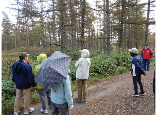
▽主伐実行済み箇所の見学

また、参加者の方から、今までの植樹した箇所 ① の生長状況など教えて欲しい旨のご意見がありましたので、次の第4回目の会合で結果を事務局より報告することとしました。皆さん深まりつつある秋を満喫され、帰路につきました。