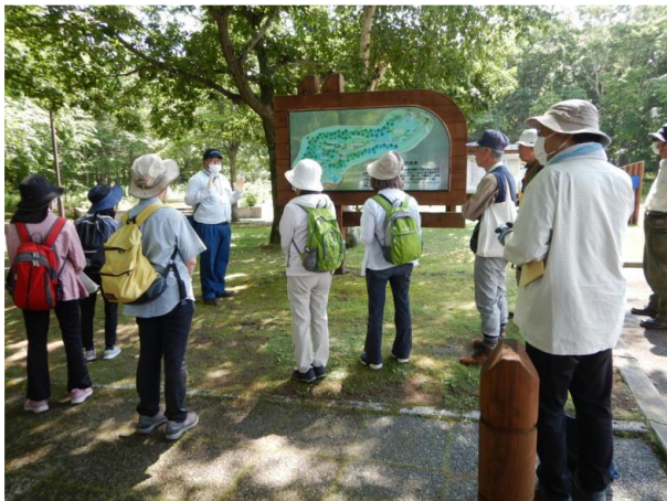
▽正美公園の成り立ちの説明

公園内の樹木見本園を散策しながら、事前に用意した資料を基に主要なミズナラ・ハルニレ・キハダ・クルミ等の樹木解説をしました。また、遊歩道沿いには、ノリウ