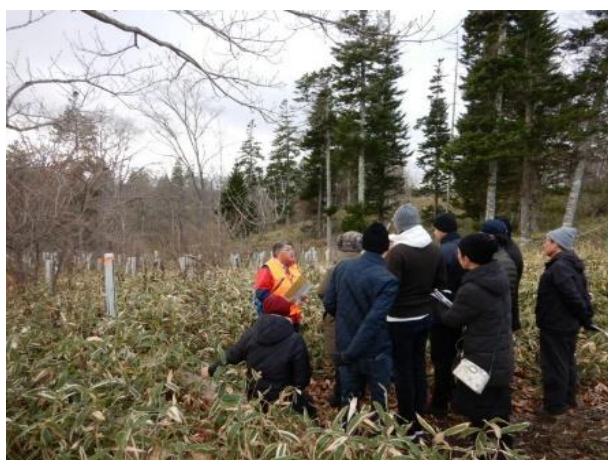
▽自然再生箇所(笹地11)の説明

その後、ここ4～5年で植栽した2箇所（笹地11、笹地10）を見学してもらい、年数がある程度経過すれば、先ほど見た箇所と同じように植栽木が保護管を超え、大きく生長していくことが想定されることから、一定の大きさ太さに達したものは保護管を外していく予定である旨話しをし、環境に配慮した施業ということで保護管の回収、資源としての再利用・リサイクルも考えている旨説明し、今年からは、最終的に自然に帰っていく「生分解性のツリーシェルター」の設置も行っていることも説明させていただきました。