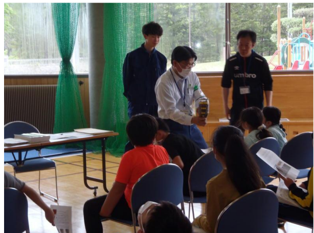
▽きれいになる水を見る児童達