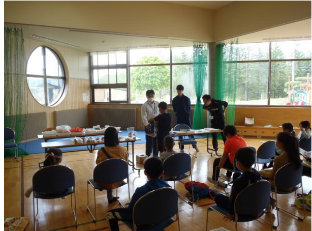
▽泥水を水質浄化装置に注ぐ様子

今後も、要請があれば少しでもお役に立てるようセンターとして積極的に応えていければと考えております。