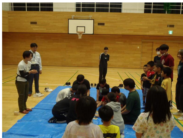
▽夏の学校林活動参加の様子