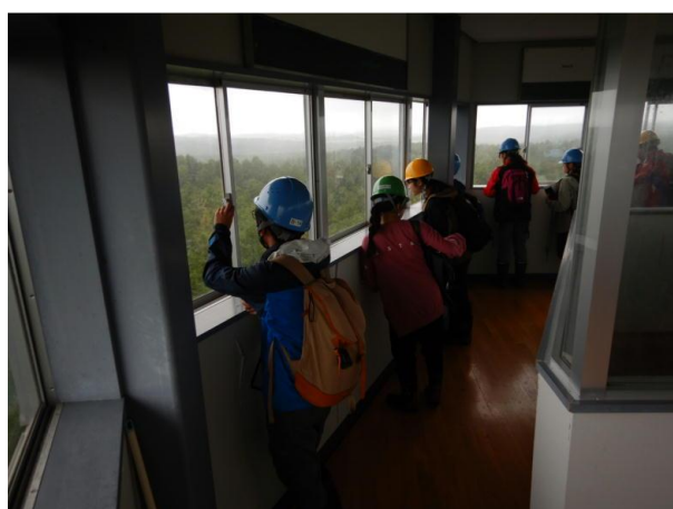
▽望楼からの眺望の様子