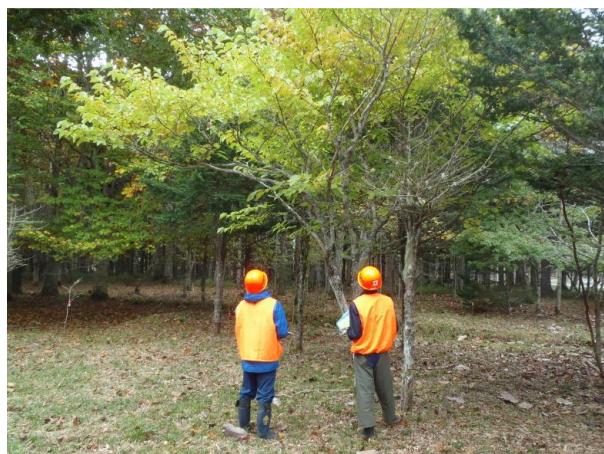
▽樹木の勉強をする研修生

最後に、当センター所長から、「参加の皆さんが各自研鑽を積まれ、本で行った研修を基礎として、形状が似た樹木の違いを木の肌や葉の違いで覚えていただければと思います。」などの挨拶があり、その後、昼食箇所も兼ね、道の駅厚岸コンキリエに立ち寄り、帰路につきました。