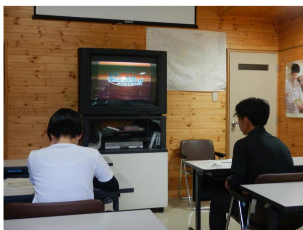
▽パイロットフォレスト紹介 DVD 視聴