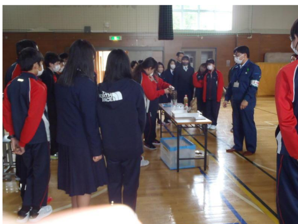
▽簡易な水質浄化体験