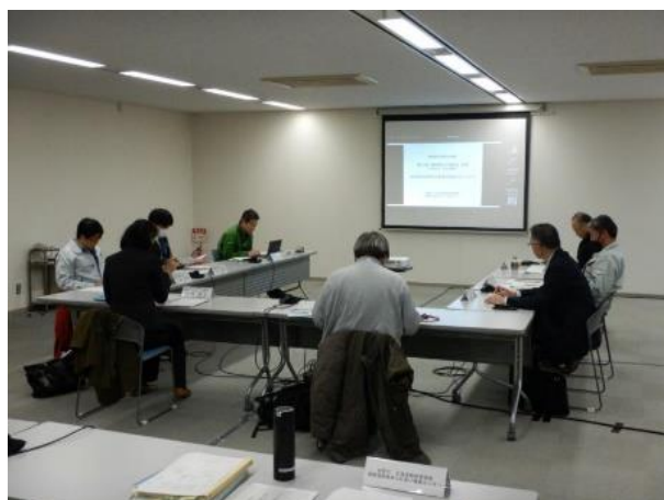
▽森林再生小委員会の様子

特に、「雷別地区自然再生事業」において植栽木を野生生物（エゾシカや野ウサギ）の食害から守る保護管（ツリーシェルター）がプラスチック製であることから一定程度大きくなった植栽木については、環境への影響を考慮し、今後、状況を見ながら保護管の撤去や再利用（リサイクル）を実施していくことと、今年度から保護管の材料が自然に還っていく「生分解性のツリーシェルター」の設置を始めたことも報告させていただきました。