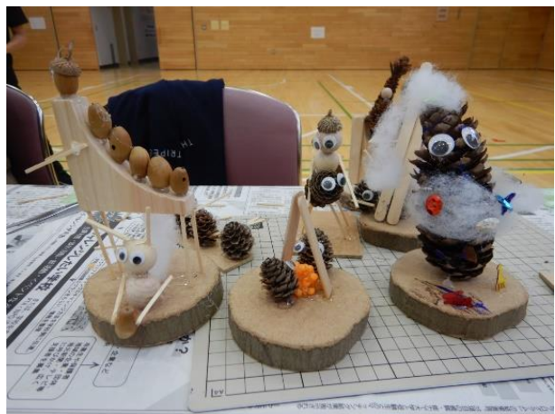
▽児童の制作した力作