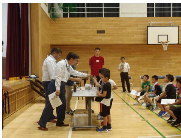
▽水質浄化装置実演の様子