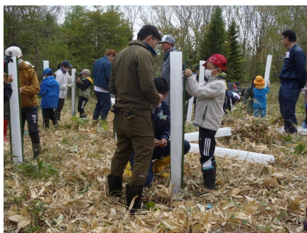
▽植栽木に保護管を設置する様子