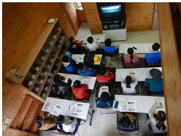
▽パイロットフォレスト紹介 DVD 視聴

パイロットフォレストの案内看板も職員から説明を行い、見学を終え次の見学地に一行は向かわれました。