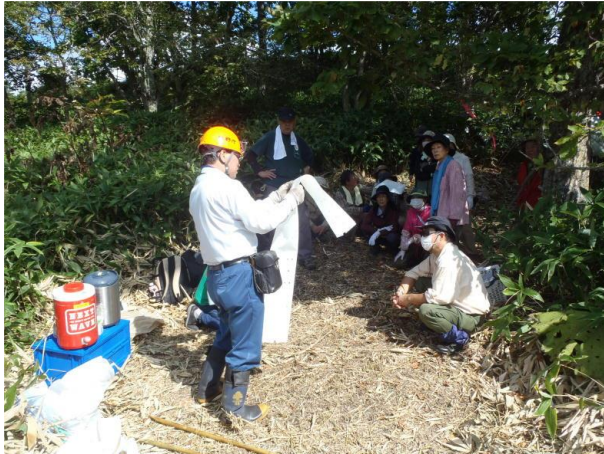
▽生分解性保護管の組立説明