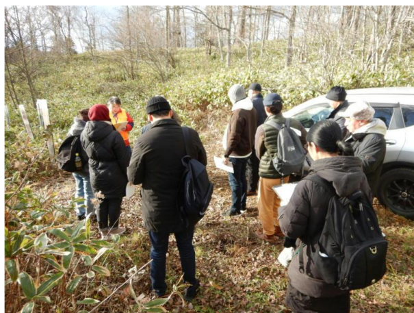
▽自然再生事業地見学の様子

次に、植栽箇所に野生生物の食害（エゾシカ・野ウサギ等）が多く見られたことから苗木を守るため、高さ1.8mのプラスチック製保護管（通称ツリーシェルター）の被覆を行った箇所のうち、最初に、平成21年に植栽し、植栽後14年が経過した笹地13のD51区画（100本植栽、うち50本に被覆）において保護管を被覆した植栽木は、順調な生育を示しており、今後の生長が期待できる状況である旨を説明し、確認してもらいました。