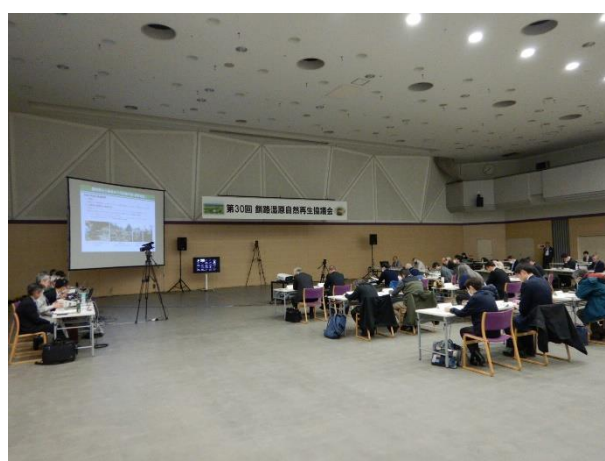
▽雷別地区自然再生事業取組状況説明の様子