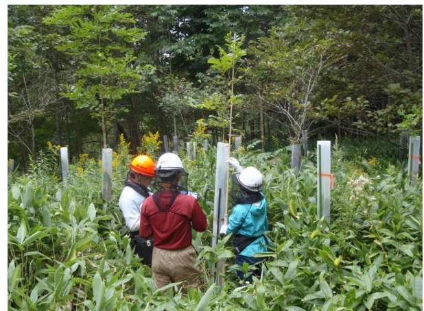
▽測桿での立木調査体験