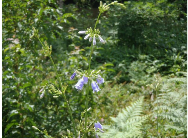
▽遊歩道沿いのツリガネニンジン