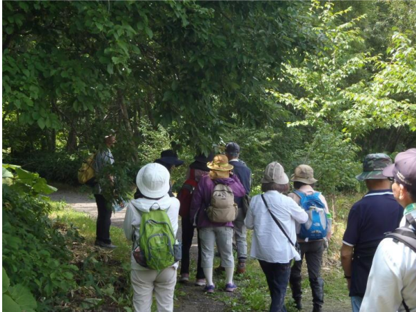
▽公園内遊歩道の散策

会員からは、「こんないい公園があるなんて知らなかった。プライベートでも来てみたい。」「なんか落ち着ける場所。来て良かった。」などめいめいが公園内をリラックスして楽しまれているようでした。こんな声にさぞ故人も喜んでくれているでしょう。故人の町への愛が詰まった公園を十分堪能し、帰路につきました。