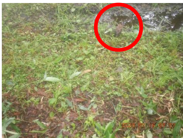
▽シギ類(R5.7 雷別 P5)