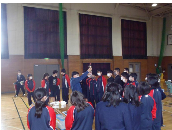
▽浄化された水を見る生徒達

生徒の中には、「こんな仕組みになっているんだ。勉強になりました。」「森林や自然を大切にしないといけない。」などの言葉が出てきて、みんな真剣なまなざしを注いでいました。