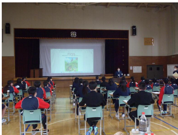
▽森林の持つ役割・働き説明

生徒の代表の方に、装置に敷き詰めるミズナラの枯れ葉を入れてもらったり、泥水を装置の上から注いでもらったりと実験の手助けをしてもらいました。浄化には時間がかかるため短時間では量が少ないですが、若干の水がきれいになるのを確認していただきました。