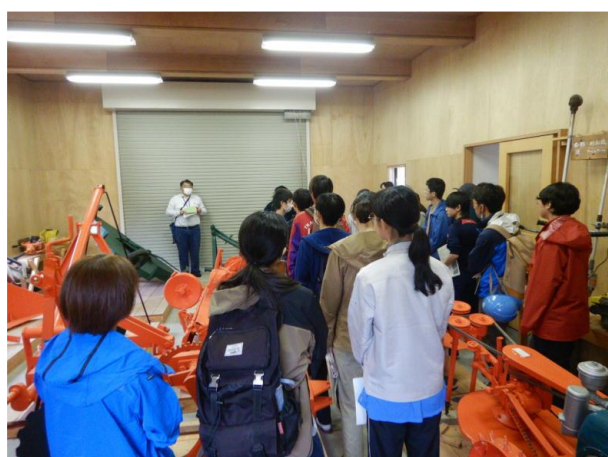
▽機械庫見学の様子