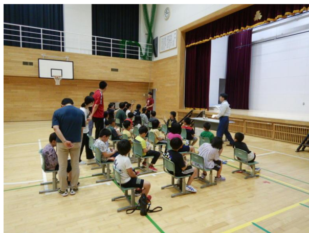
▽カルタの解説の様子

今回の学校林活動は学校内での実施となりましたが、次回の活動は学校林で実施できることを願っています。