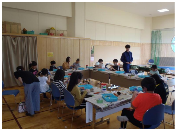
▽ミニツリーづくりの様子