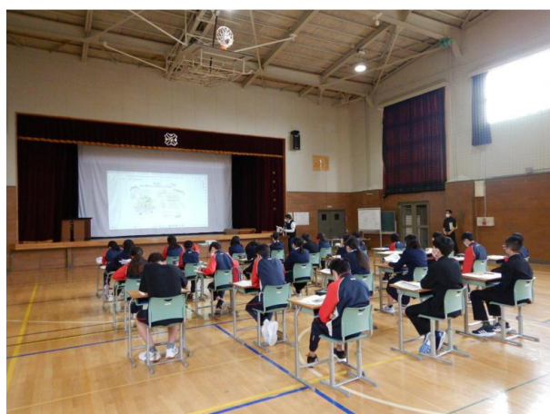
▽水源かん養機能説明の様子

次に、森林の水源かん養機能として、分かり易い図解のマンガで、森林が水を蓄える機能があるのと同時に土砂の崩壊を防止すること、緑のダムとなって徐々に河川に水が流れていくので、乾季が続かない限り、川にはいつも水が流れ、日常生活用水にも使われていること。そして、私達の生活をするうえで必要不可欠なものとなっていることなどの解説を実施し、身近にある森林の役割を幅広く知ってもらいました。