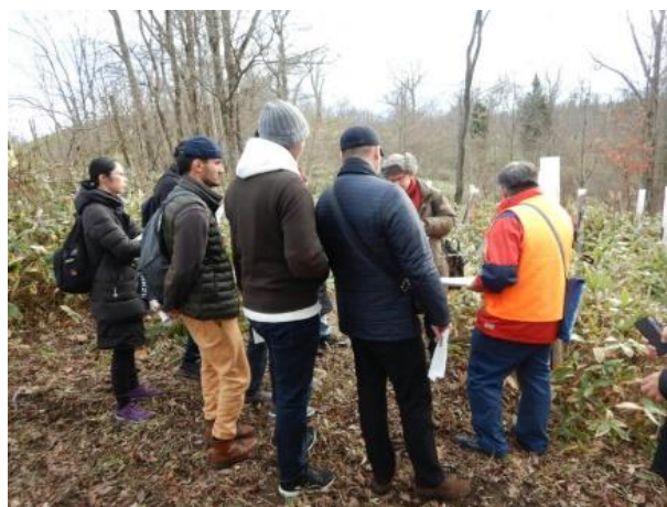
▽自然再生箇所(笹地10)の説明

研修員からは、「地域住民やボランティア団体、学校、企業などとの協働の取り組みは興味深く参考になりました。自分の国でもできれば実施してみたい。」「自然に帰るものとして、植物の「ヨシ」を編んで保護管を作ったりしている。他の材料でもやってみたい。」など積極的な意見や考え方等の提言がありました。質疑応答