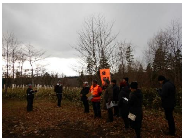
▽質疑応答・まとめ