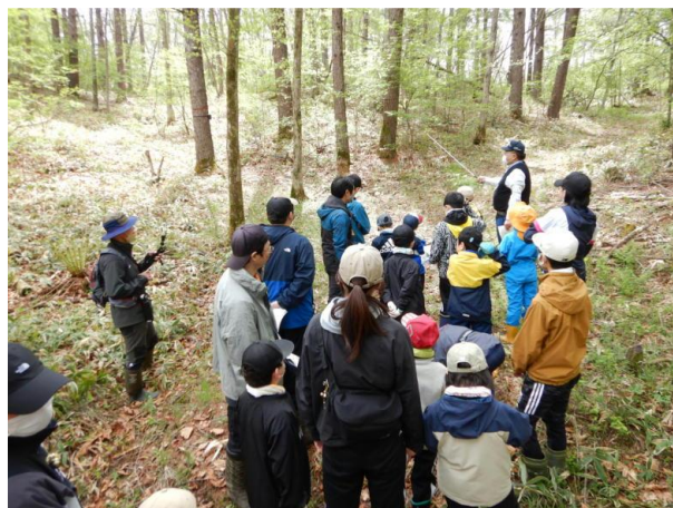
▽遊歩道の樹木解説の様子

次に植樹場所に移動し、標茶町森林組合が「植樹」、当センターが植栽木を野生生物（エゾシカ・ユキウサギ等）の食害から保護するため「保護管（ツリーシェルター）の被覆」について説明したあと、3 班に分かれて植樹、保護管の被覆を行いました。