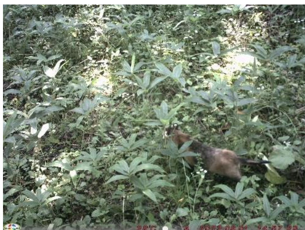
▽ネコ(R5.7 雷別 P1)

今後もこの調査を継続し、森林の変化や野生生物の生息動向を注視していきたいと考えています。