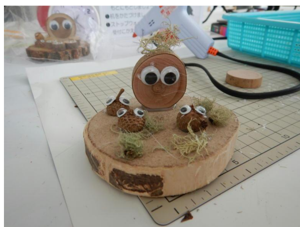
▽参加者の完成した作品