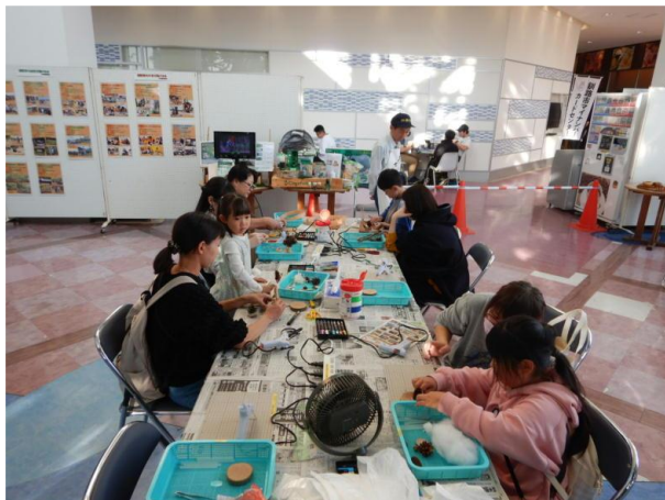
▽ミニツリーづくりの様子

当センターは14日（土）に、根釧西部森林管理署と連携して、マツボックリ・木の輪切りや枝等で「ミニツリーづくり」を企画したところ、開始早々から親子連れや友達同士などが続々と当ブースを訪れ、ミニツリーの見本を参考に材料選び、木工クラフトづくりを楽しんでいました。また、当日は別の場所イベントがあることから参加者が少ないのではと思っていましたが、午後からは多くの方が訪れ、用意した席がいっぱいになる時があるなど、会場は大いに賑わいました。来年度以降も実施があれば協力していきたいと思えます。