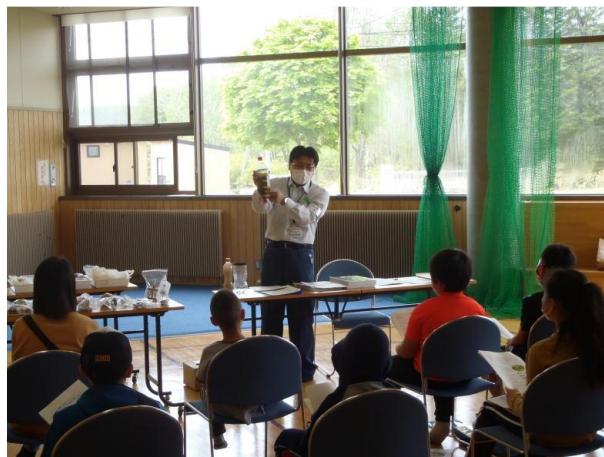
▽水質浄化装置説明