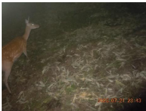
▽エゾシカ(R5.7 雷別 P2)