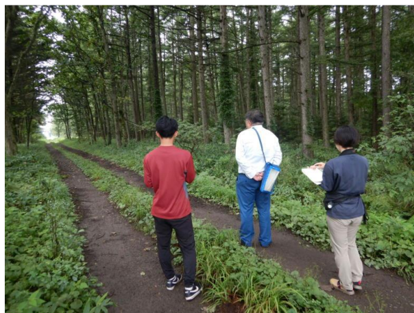
▽防風保安林見学の様子