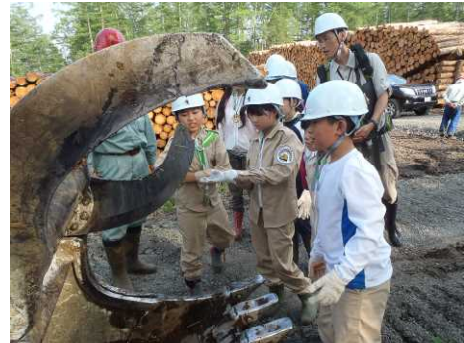
▽高性能林業機械に興味津々な子ども達