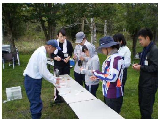
▽タネ等の解説を聞く研修生

当センターは、森林環境教育の取組みの紹介、タネ、樹木と葉、動物等について解説し、ロケット・ラワンづくりを通じて、いろいろなタネの飛び方や運ばれ方を実感していただきました。