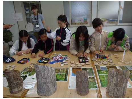
▽木の名札づくりの様子

子どもたちからは、「木がどれだけ大切か、わかった。」や「木の勉強も意外といい。」等の感想がありました。