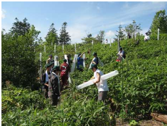
▽保護管で被覆する様子

参加者からは、「学生とともに社会貢献活動ができ、楽しい時間が過ごせました。」や「植栽木の成長が楽しみです。」等の感想がありました。