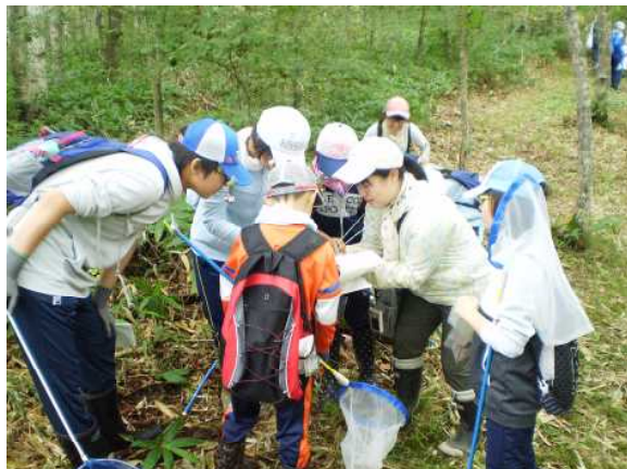
▽見つけた生きものを記録する様子