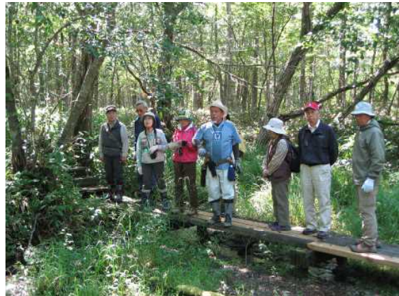
▽地勢の解説を聞く様子