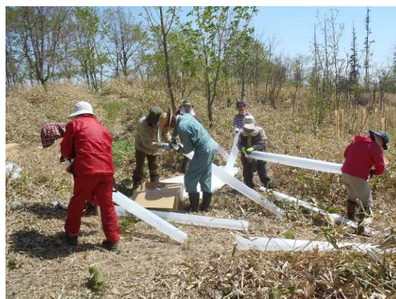
▽保護管を組立てる様子