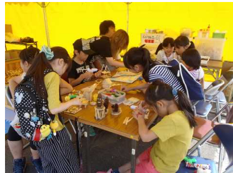
▽木工クラフトづくりの様子

当日は秋晴れの暖かい一日で多くの来場者が訪れ、家族連れや子どもたち等は、イベント閉会間際まで、木工クラフトづくりを楽しんでいました。