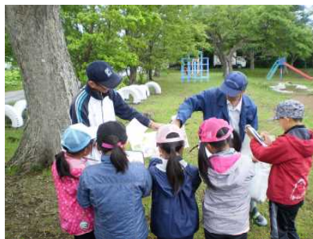
▽解説を聞きメモを取る様子

子どもたちは、葉を触ってみたり、臭いを嗅いでみたりしながら、樹木の特徴等をつかんでいました。