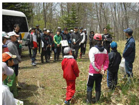
▽学年代表による発表の様子