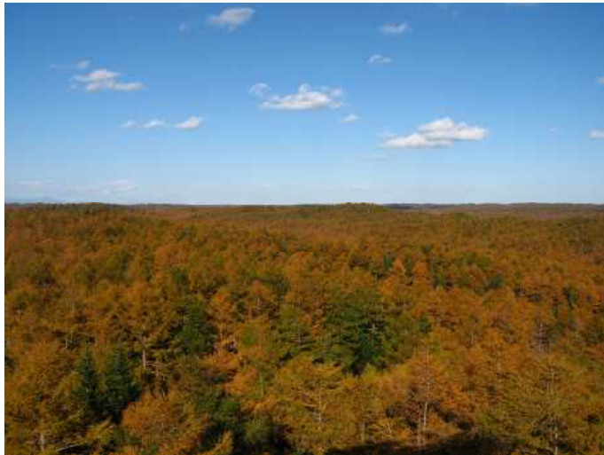
▽黄金色に染まるパイロットフォレスト国有林

参加者からは、「秋の紅葉の時期の他、春の若葉時期や夏の深緑の時期も開催してほしい。」等の感想がありました。