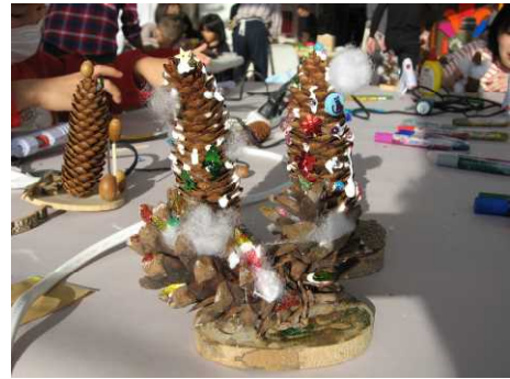
▽完成した「ミニツリー」

国有林のブースの他、会場では「タンチョウのオブジェ」づくり等の木工体験や「木の玉プール」、「木の積み木」等の木製遊具も用意され、小さな子どもたちが楽しそうに遊んでおり、この2日間で600人を超える来場がありました。