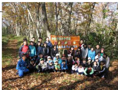
▽新たに設置した看板の前で

当センターは、平成18年度からこの学校林活動に携わっており、平成30年度は春・夏・秋の3回、自然観察等の活動を支援しました。