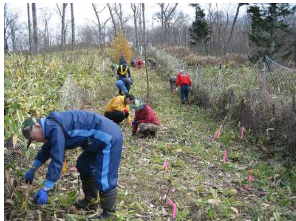
▽稚樹刈出しの様子

今回は、今年の7月12日と26日の猛暑の中、植栽木をエゾユキウサギの食害から保護するため、防兔柵を設置した笹地12で稚樹の刈出しを行ったもので、会員の方々は秋も深る寒空の下、黙々と作業を行っていました。