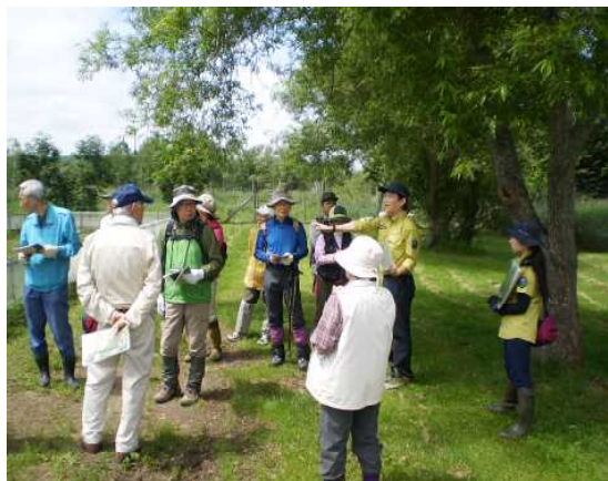
▽苗畑の説明を聞く様子

当日は、同事務所のご担当者から、当該事業の目的を始めとして、広葉樹苗木の育成や森林再生等について、現地を見学しながらご説明をいただくとともに、「森林と湿原のつながり」のご説明もあり、会員は熱心に聞き入っていました。