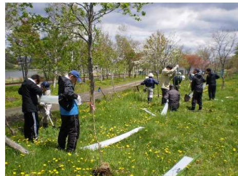
▽保護管組立ての様子

当日は、会員15名程の参加があり、ヤチダモ・ミズナラ・エゾヤマザクラを植樹するとともに、植栽木をエゾシカによる食害から保護するため、保護管(ツリーシェルター)で被覆しました。