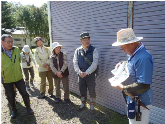
▽ヒグマの解説を聞く様子

参加した皆さんからは、「今後の森林づくり活動に参考となるお話を聞くことができ、大変有意義な一日でした。」や「釧路川源流部の貴重な森林の散策と専門的な解説を聞くことができ、大変勉強になった。」等の感想がありました。