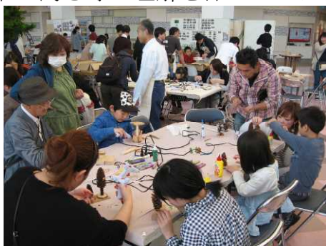
▽国有林ブースの様子

この催しは、地域住民の方々に木育の取組みを通じて、森づくりの重要性や協働の森づくりへの関心を高めていただくことと併せて、木とふれあう機会を提供し、木の良さ等の理解を深めていただくことを目的として、「釧路町村会」と「くしろ森と緑の会」が呼びかけ人となり、釧路地方の森林・林業に係わる国・北海道・市町村・関係団体等が連携・協力して開催されたものです。