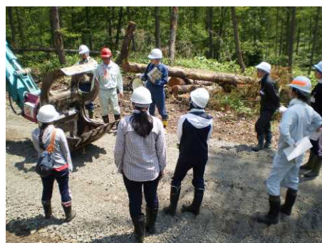
▽森林整備作業現場で説明を聞く研修生

この研修で国有林は、森林作業現場の見学と木育体験等を企画し、森林整備作業現場の見学では、高性能林業機械による伐倒・玉切り等のデモンストレーションが行われ、大きな木があつという間に倒れ、丸太になっていく工程に、研修生から驚きの声が上がっていました。その後、研修棟へ移動し、自己紹介を交えたアイスブレイクを行うとともに、森林管理署担当者の解説で、パイロットフォレスト造成時の様子を記録したDVDの視聴や望楼見学等を行いました。