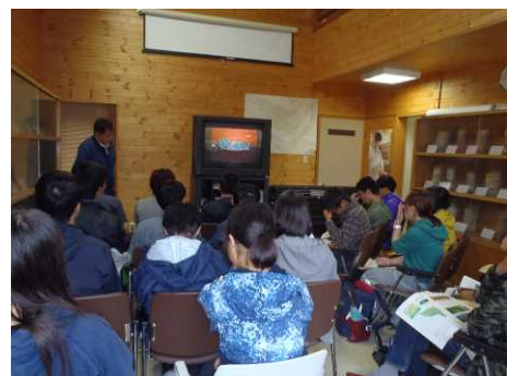
▽DVDを視聴する学生の様子

時折、雨が降る悪天でしたが、学生からは「見渡す限りのカラマツ林が、雄大でした。」や「望楼からカラマツ林を見ることができて、感動しました。天気の良い時にまた、見に来たいです。」等の感想がありました。