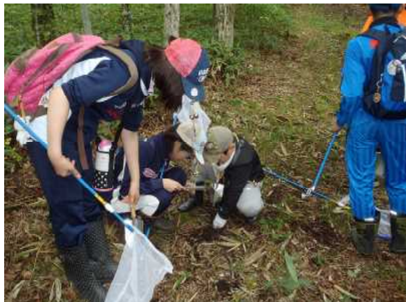
▽土の中の生きものを探す子ども達

各班は、「るんるんフォレスト」の遊歩道や笹地・水辺等で、虫や生きものを探すとともに、見つけたものを記録し「見つけた場所ビンゴカード」で、何列ビンゴできるか、競っていました。