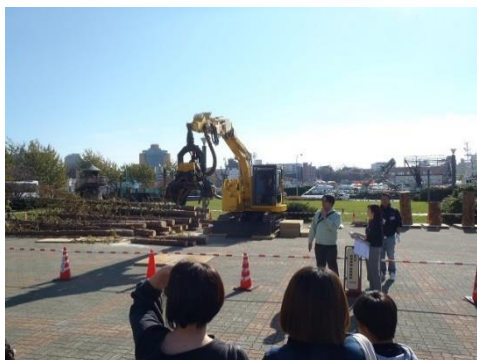
▽高性能林業機械実演の様子