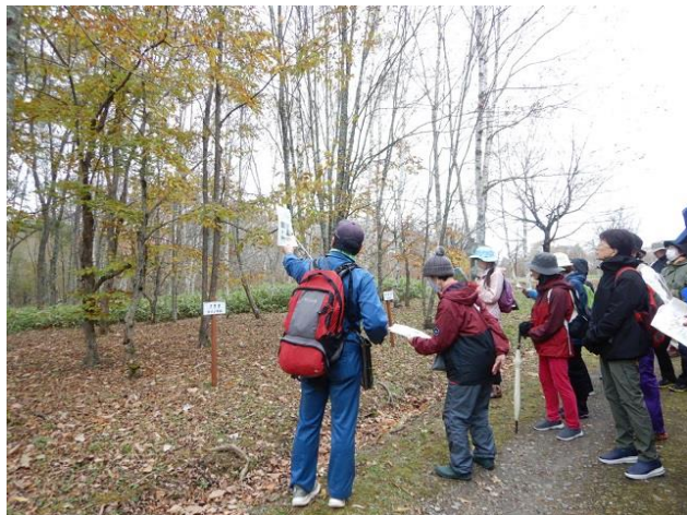
▽見本木の解説を聞く参加者の様子

まず始めに、当センター職員が園内にある約20本の見本木を解説しました。この見本木は、昭和60