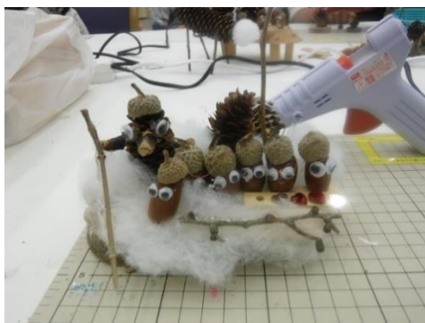
▽完成した作品の様子

この2日間は、道産材を使った車作りや木のたまご作り、トドマツやカラマツを使ったアロマウオーター作り等、38ブースが展開されており、多くの来場者で賑わっていました。