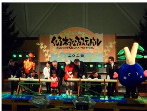
▽開会式の丸太カットの様子

釧路市(釧路・阿寒・音別)の豊かな森林資源を活用するため、木材の供給側から需要側までの幅広い関係者により、平成22年に「釧路森林資源活用円卓会議」が設立され、「地域内での地域の木材消費向上」を目指した様々な取組みが行われており、今回の催しは、木を「見て」「触れて」「感じる」体験を通じて、釧路の「木づな」を創り、釧路産木材の積極的な活用を促すことを目的として開催されました。