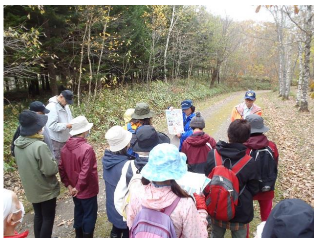
▽園内の樹木解説を聞く参加者の様子

当日は、雨予報でしたが、昼食時まで雨は降らず、当センターの「テレル坊主」君も活躍しました。