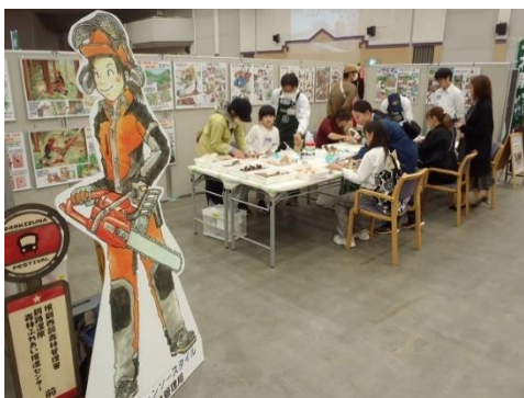
▽根釧西部署と当センターブースの様子