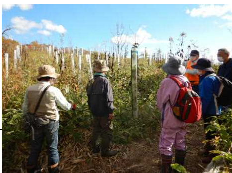
▽令和3年度活動風景（前年植樹箇所の見学）