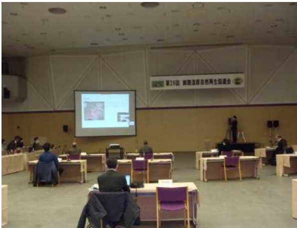
▽「釧路湿原自然再生協議会」運営会場の様子

当日は、協議会構成員の公募結果について、新規で個人6名の応募があり、第10期の構成員が総勢148名となったことが報告されるとともに、協議会の収支報告や各小委員会から開催報告がありました。当センターは、森林再生小委員会の開催結果のうち、雷別地区自然再生事業における森林再生の取組状況や次年度の予定を報告し、意見交換を行いました。