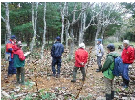
▽令和3年度活動風景（厚岸樹木園自然観察）

今回、会員を募る「雷別ドングリ倶楽部」は、平成19年7月から活動しており、雷別国有林の「森林づくり活動」等に継続的に関わっていただいているボランティアの方々を集まっています。