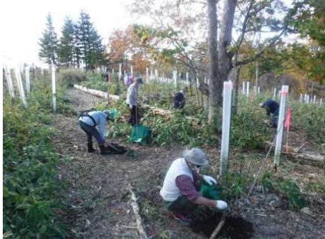
▽令和3年度活動風景（広葉樹の植樹）

シラルトロ湖に注ぐシラルトロエトロ川の最上流部に位置する雷別地区国有林には、林齢が70年を超える森林が広がっていますが、平成12年にその一部のトドマツ人工林が、立ったまま枯れてしまふ被害に遭い、笹地となってしまう箇所があります。当センターでは、この被害箇所を郷土樹種である多様な広葉樹（ミズナラ、ヤチダモ、ハルニレ、カツラ等）を計画的に植栽する等、森林再生に取り組んでいます。