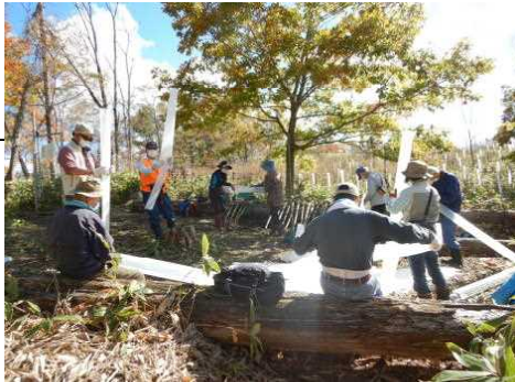
▽令和3年度活動風景（保護管の組立て）