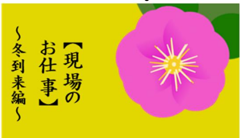
【現場の お仕事】 〜冬到来編〜

雪に閉ざされ、山岳に 行くことが難しくなる 冬季、当署では防風林 の管理を主に業務を行 う場合が多くなります。 山岳に入る際には、車 は使えないため、スキー 板を履いて徒歩で現場 まで向かいます。雪上に 点々と残った動物の足 跡は可愛いものです。