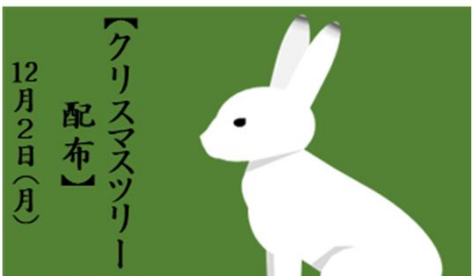
【クリスマスツリー 配布】 12月2日(月)

署内メンバーの有志を集 い、少し早いクリスマスバー ティを行いました。一人一 品料理を持ち寄ってご飯 を食べた後、ボードゲーム やプレゼント交換を行い、 非常に楽しい一日でした。 プレゼント交換でいただいた ハンドクリームは、毎日 寝る前に使用しています。