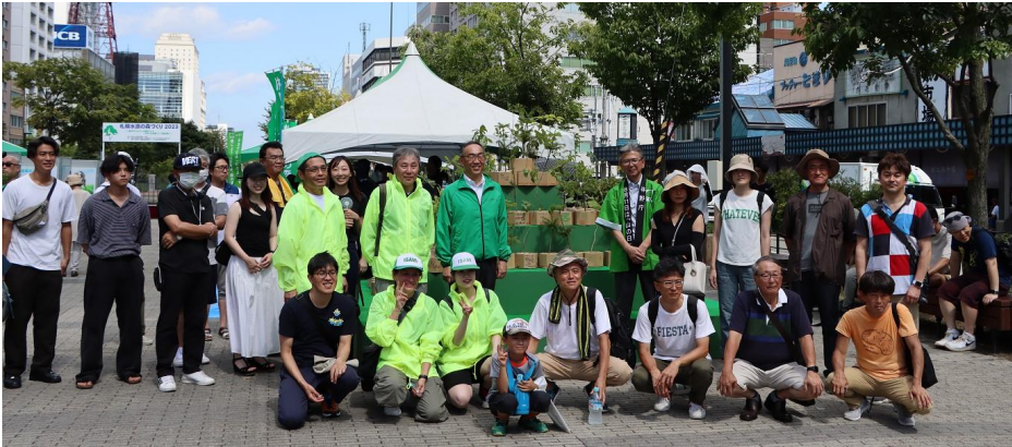
[イベント参加者と記念撮影]