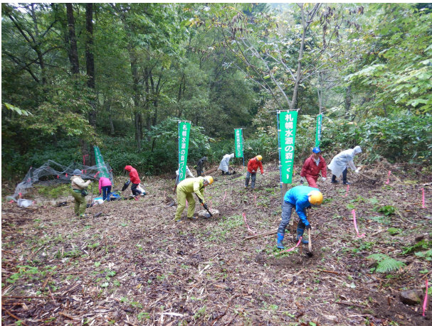
[植栽箇所の植穴堀]

当日は小雨が降る天気でしたが、「札幌水源の森づくり2023」イベントのボランティアスタッフ、協力機関機関の方々に全ての苗木を植栽することができました。