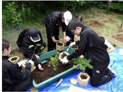
[カミネッコンに苗木を植栽]