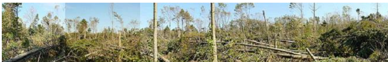
[平成 16 年 9 月に発生した台風 18 号の被害直後]

平成 16 年 9 月の台風 18 号により、被害を受けた野幌の森林を「100 年前の原始性が感じられる自然林」を目指した森林づくり「野幌森林再生プロジェクト」を策定し、平成 17 年度から各種取り組みを実施しています。ここでは、野幌の豊かな自然のすばらしさ、森林に関する理解の醸成等、NPO 団体等と協働による森林づくりに取り組んでいます。