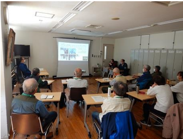
[当センター職員による座学の様子]

第 1 回目の森林づくり塾は、「森林と水について」と題して、森林と水の関わりを北海道森林管理局内会議室において当センター職員から座学を行った後、午後から札幌市水道記念館に移動し、森から水道水が届くまでの流れを学びました。