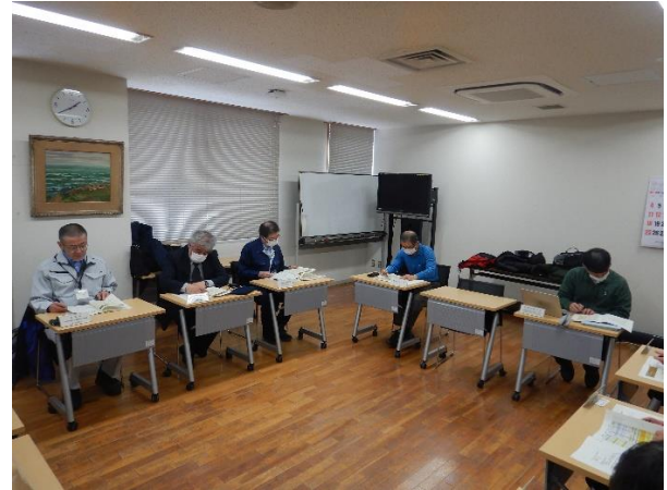
[出席された各構成団体の皆様]