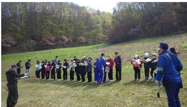
[センター職員から調査方法を説明]

定山溪中学校が保護活動をしている三笠緑地において、中学校と小学校（5・6年生）の合同で、植生の開花調査を実施しました。この植生調査は環境保全活動の一環として、平成25年から継続して実施しています。また、調査終了後、中学生は環境保全活動の看板を設置しました。