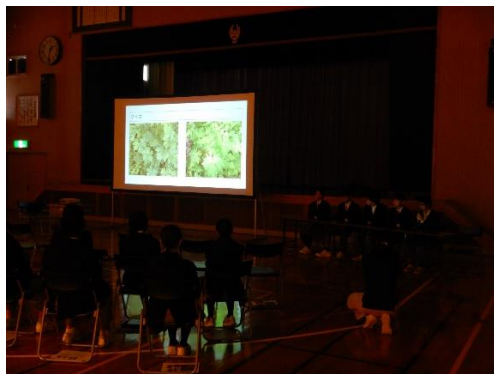
[中学生の発表の様子]

定山溪中学校からは「Let's grow with the forest.」と題して、今年度の「夢の森」での活動内容等を報告しました。