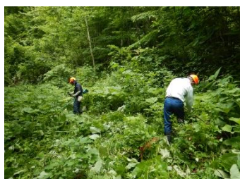
[下刈り作業の様子]