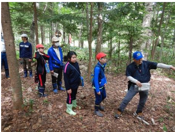
[職員による説明の様子]