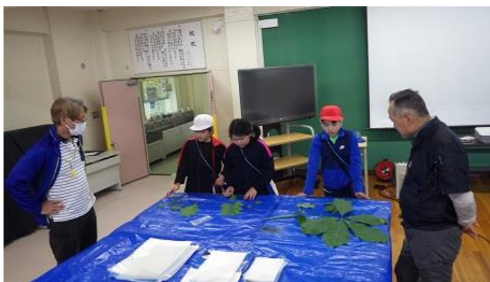
[パウチ作りの様子]