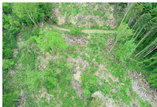
[風倒木の処理痕の状況 (R4. 5. 31 ドローンで撮影)]