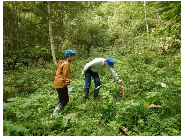
[9月に実施した横浜市立大学生の様子]