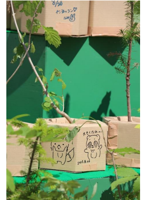
[メッセージが書かれた苗木]