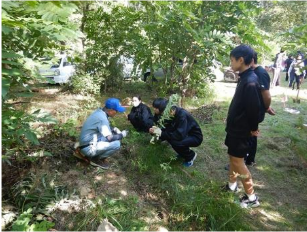
[ヤナギ挿し木説明]