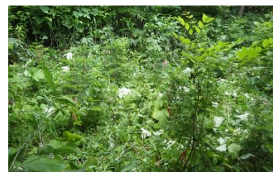
[下刈り後の苗木の様子]