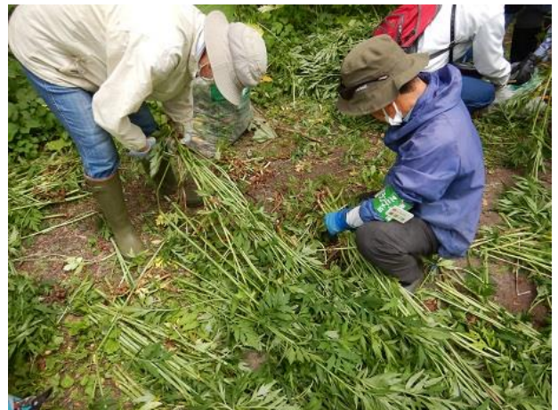
[根の切り取り様子]