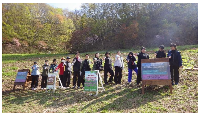
[中学生による看板設置]