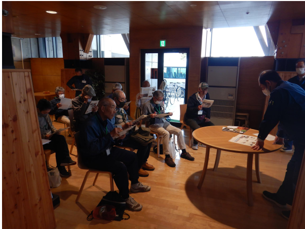
〔当センター職員による座学の様子〕

前段、当センター職員より「きのこの生態と豆知識」と題した講話を行い、その後、きのこ展示・鑑定会を見学しました。