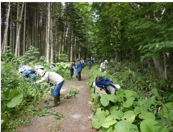
[オオハンゴンソウの抜き取りの様子]