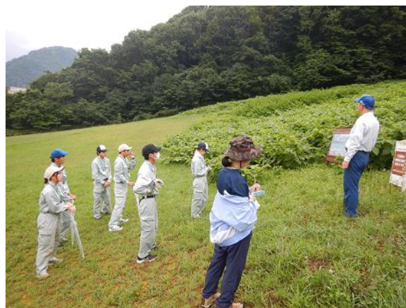
[8月に実施した酪農学園大学生と札幌工科専門学校生の様子]