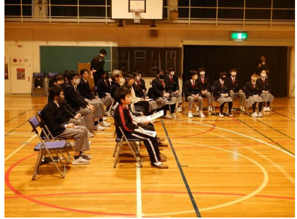
〔フリーディスカッションの様子〕