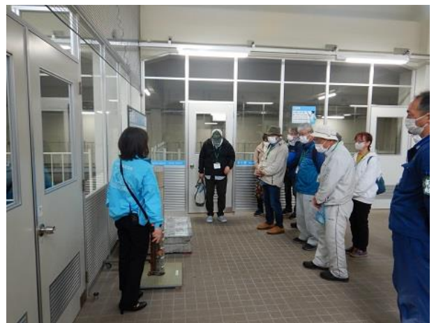
[札幌市水道記念館（藻岩浄水場）見学の様子]