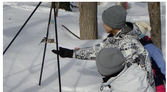
〔生徒撮影“ハシブトガラ”の写真〕