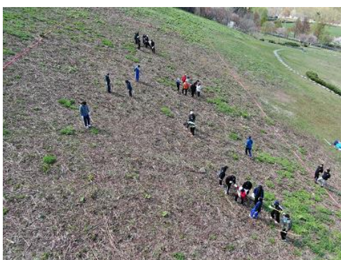
[調査の様子をドローンから空撮]