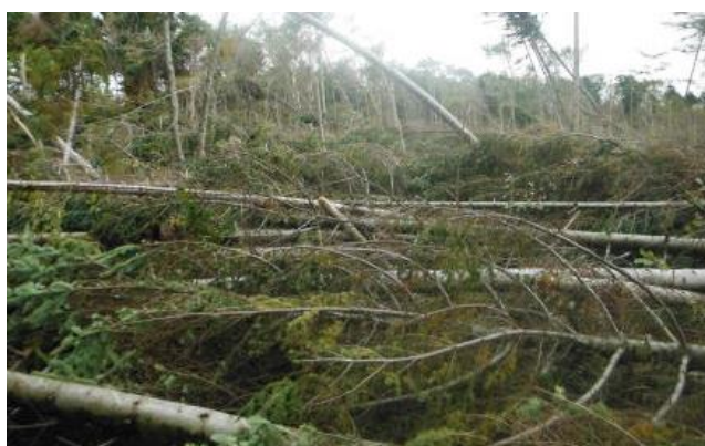
[平成 30 年台風直後の被害状況]

また、本プロジェクトのほか、平成 30 年 9 月に発生した台風 20 号による風倒被害箇所の一部を利用して、新たな森林再生に向けた取り組みを令和 4 年度からスタートしました。