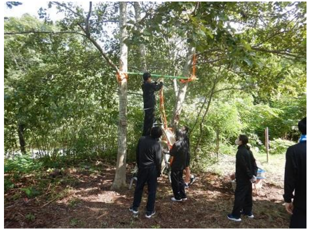
[夢の森ブランコの設置]