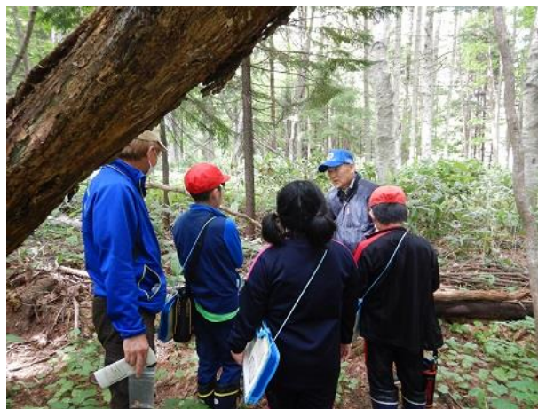
[腐朽して朽ち果てた樹木を観察]