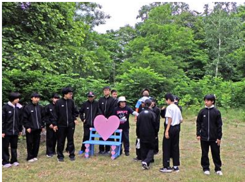
[今年度も生徒作製のベンチを設置]