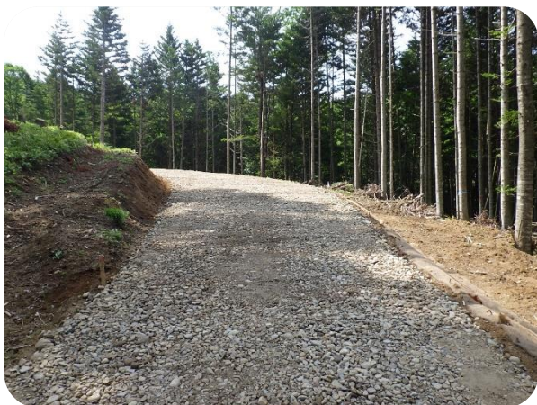
林業専用道新設工事