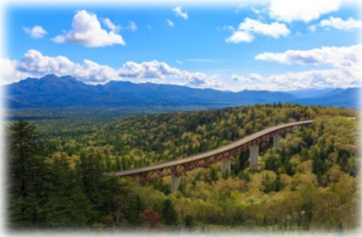
三国峠から見下ろす樹海