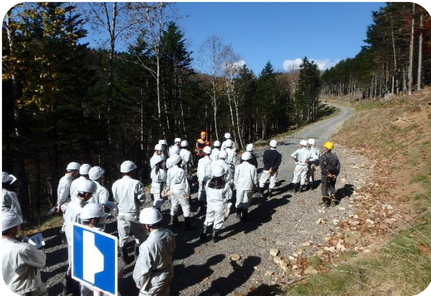
帯広農業高校の新設林道見学