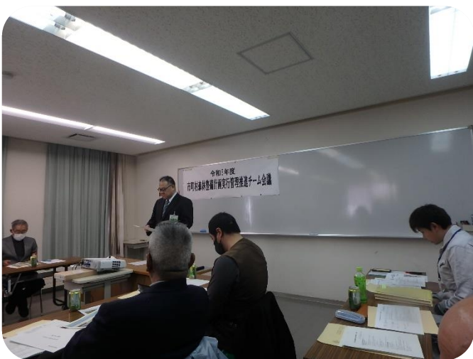
市町村森林整備計画実行管理推進チーム会議 (足寄地域合同)

当支署では、地域の森林・林業・木材産業の課題について林政連絡会議等により情報共有、連携を図り技術情報の提供を行っています。