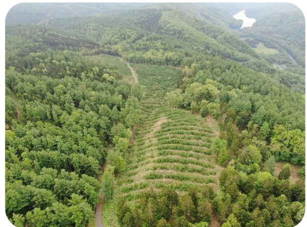
ドローンによる森林調査