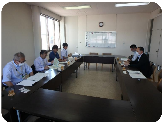
林政連絡会議 (新得町)