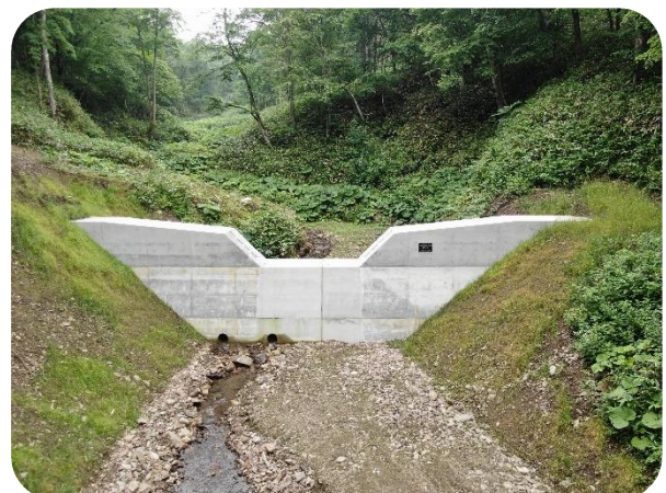
溪床の安定を図る治山工事