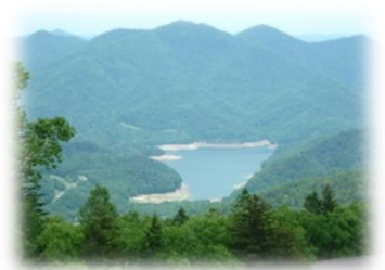
水源涵養タイプ(上士幌町)