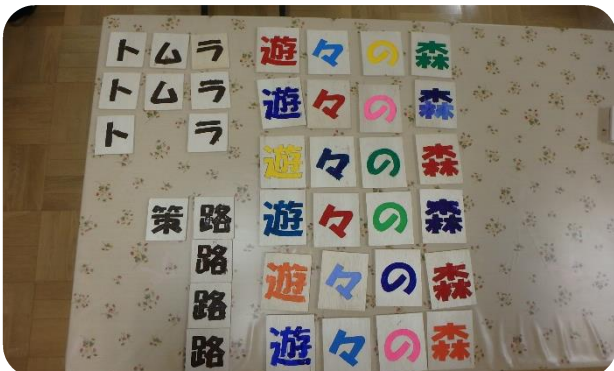
富村牛小中学校生徒による遊々の森看板作成