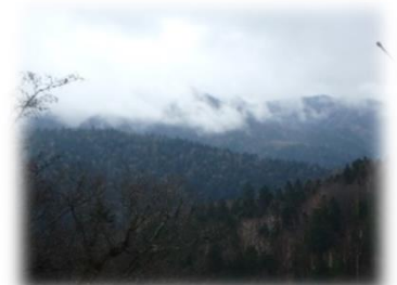
自然維持タイプ(新得町)