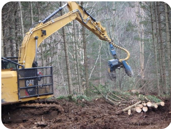
高性能林業機械による間伐作業