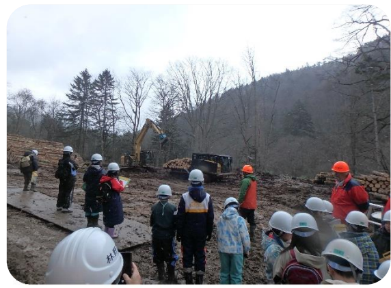
屈足南小学校現場見学