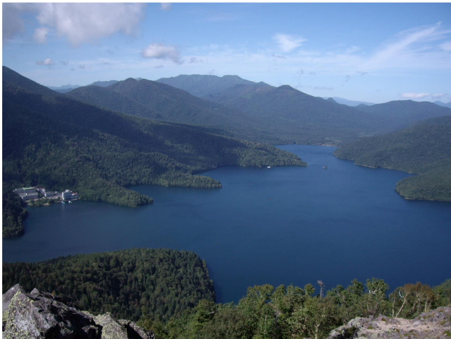
白雲山より然別湖を望む