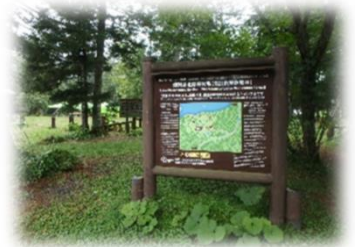
森林空間利用タイプ(鹿追町)