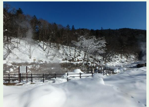
休養林内にある天然温泉