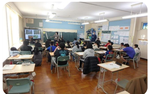
上士幌小学校出前授業