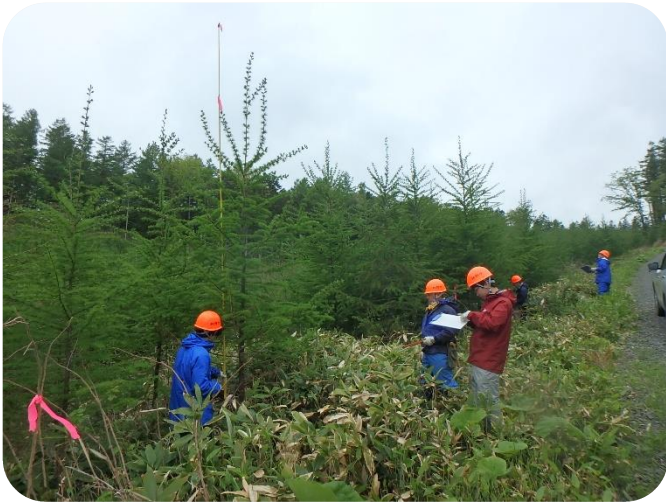
無下刈施業によるクリーンラーチ生長量調査 (H30年植栽)

当支署としても下刈作業省力化に向けて、実証地の設定を行い低コスト造林技術の普及を目指しています。