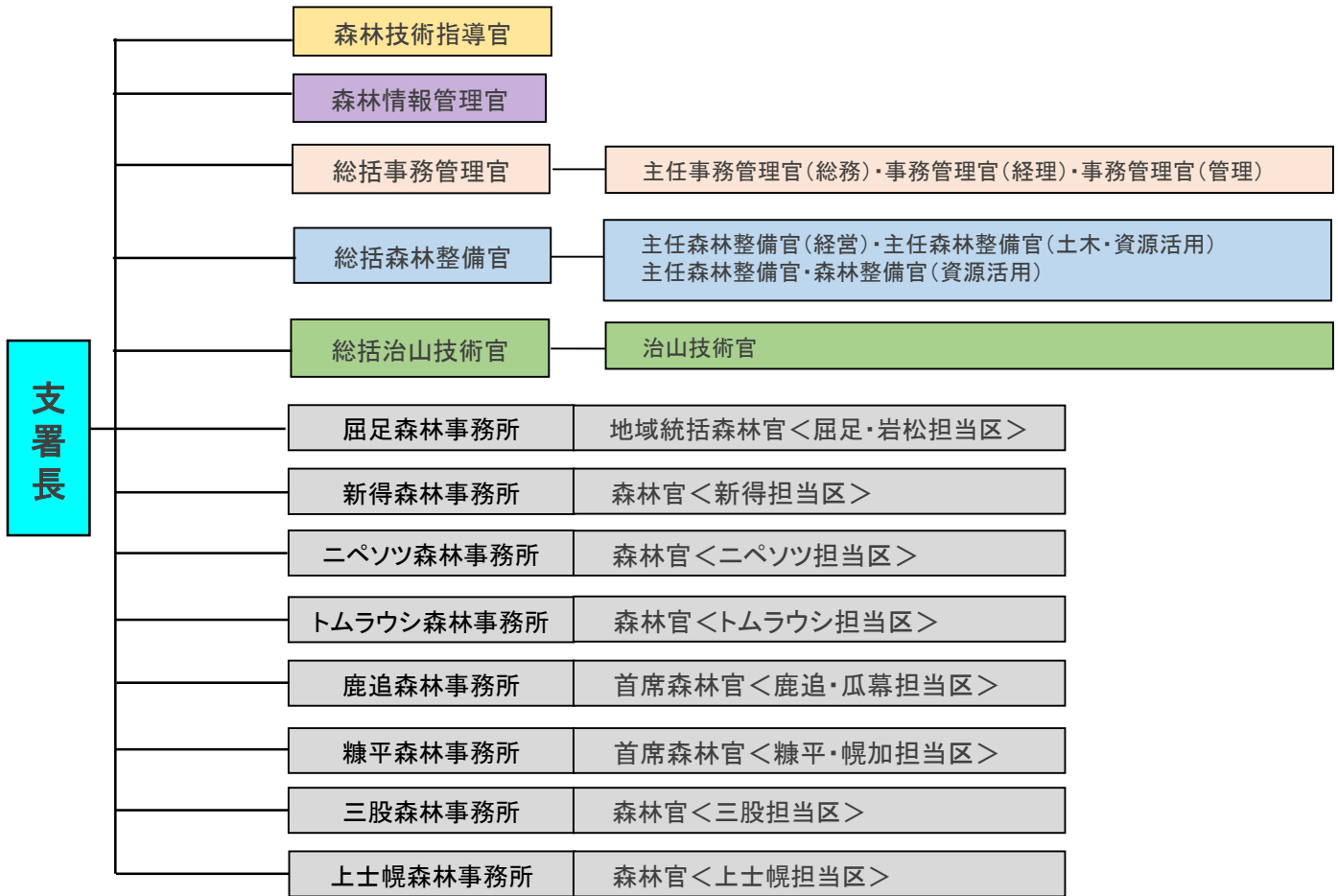
職員数(令和6年4月1日現在)