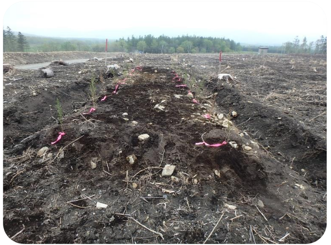
両脇を掘削した盛土地拵 (R5年植栽)