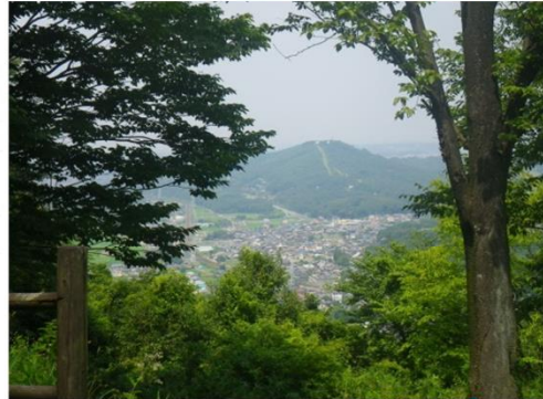
休憩所からの眺望