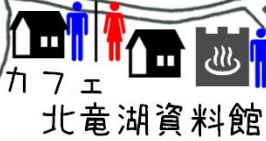
カフェ 北竜湖資料館