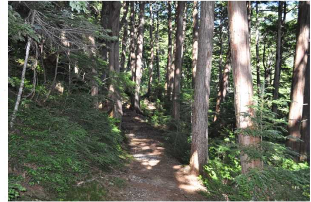
原生林内の遊歩道