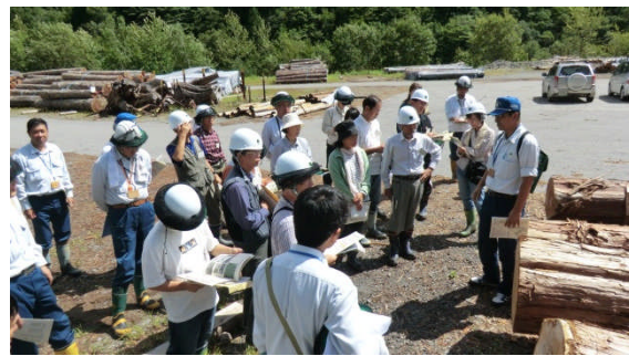
（木曽ヒノキについて説明（氷ヶ瀬土場））

まず、最初に、木曽郡王滝村の御岳国有林の濁川の現場に向かいました。現地では、昨年 9 月の御嶽山噴火に伴う土石流対策として設置した土石流センサー・監視カメラや緊急除石対策工事について、また、現在実施中の復旧治山工事の概要や昭和 59 年の長野県西部地震災害の復旧等の取り組みについて、木曽森林管理署梅田総括治山技術官より説明を行ないました。