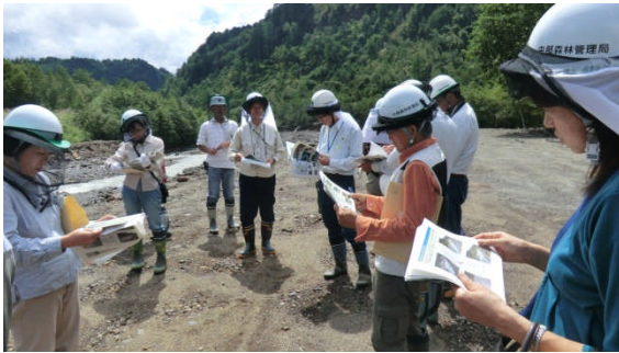
（御岳山噴火に伴う緊急除石対策の現地説明）

当日は、35 名の国有林モニターさんのうち 18 名の皆様が参加し、当局から総務企画部長、木曽森林管理署長等が案内しました。