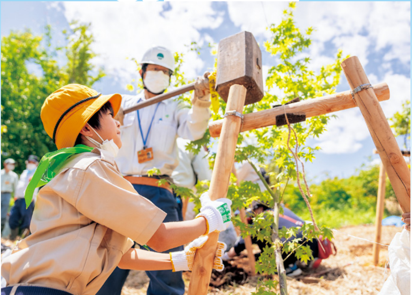
長野地域森林祭・みどりの少年団と力を合わせて風倒防止用の支柱を設置