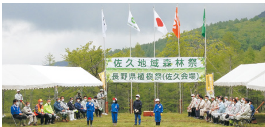
佐久地域森林祭・みどりの少年団による「みどりのふれあい宣言」

「シラカバ」の苗木の記念植樹および約三百名の参加者全員で「カラマツ」のコンテナ苗を、額の汗をぬぐいながら丁寧に植え付けました。 参加者は、十年後、二十年後の成長に思いをはせながら、佐久地域でのカラマツ林業の再生を願い、無事作業を終えました。