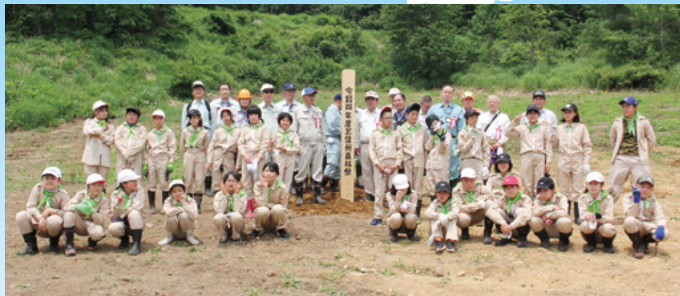
北信州森林祭・北信地域の市町村が協力してカラマツを植樹

六月十八日、下高井郡木島平村池の平地区にて、北信州森林祭が開催されました。 当日は、木島平村のみどりの少年団、北信地域の各市町村長等ら約百三十人が参加し、「カラマツ」四百五十本を植樹しました。