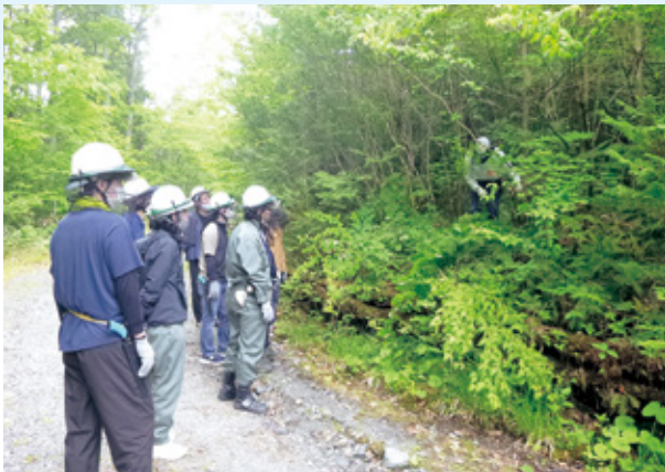
除伐作業の指導を受ける生徒たち

当署では、今後もこのような体験を通じて、人材育成の一助となるよう努めていく考えです。