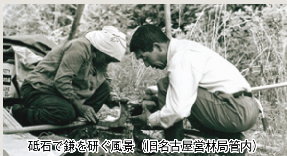
砥石で鎌を研ぐ風景 (旧名古屋営林局管内)

昭和三十年代中頃から国有林でもガソリンエンジンの刈払機 かりはらいき (下刈り用の機械)が導入され始めました。肩掛け式の刈払機は現在でも見られますが、背負い式の刈払機が使われていたこともあります。また時代が経つにつれ電池式の電動刈払機も使用されるようになっていきました。