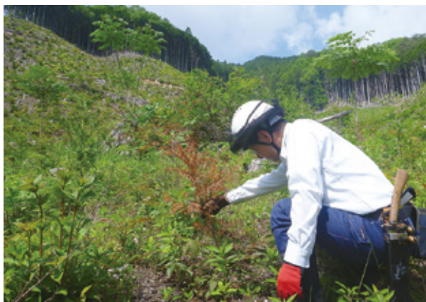
野ウサギの被害状況を調べる筆者

木が全部食べられた現場もあり、被害は深刻です。今後は、野ウサギの食害対策を検討していきたいと考えています。