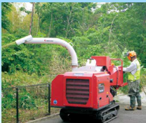
除去した竹のチップー粉碎作業

【富山森林管理署】 五月二十一日、「社会貢献の森」の協定を締結しているNPO法人きんたろう倶楽部（以下「倶楽部」と富山市大沢野国 おおさわの 有林において、竹の除去作業及び除去した竹のチップー粉碎の作業を行いました。大沢野国有林は防風保安林に指定されており、下層植生を促進させ防風機能を維持することを目的に、「風とせせらぎの森林」の名称で二〇一〇年より活動を行っていただいております。