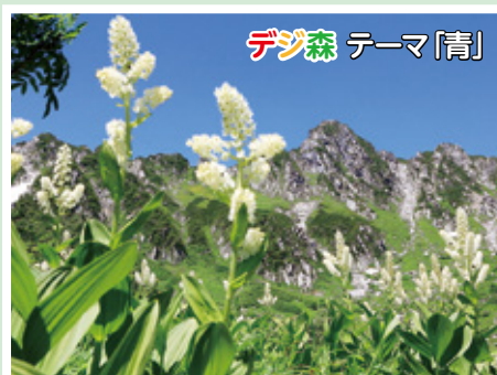
27. [コバイケイソウと中央アルプス] (南信署管内)