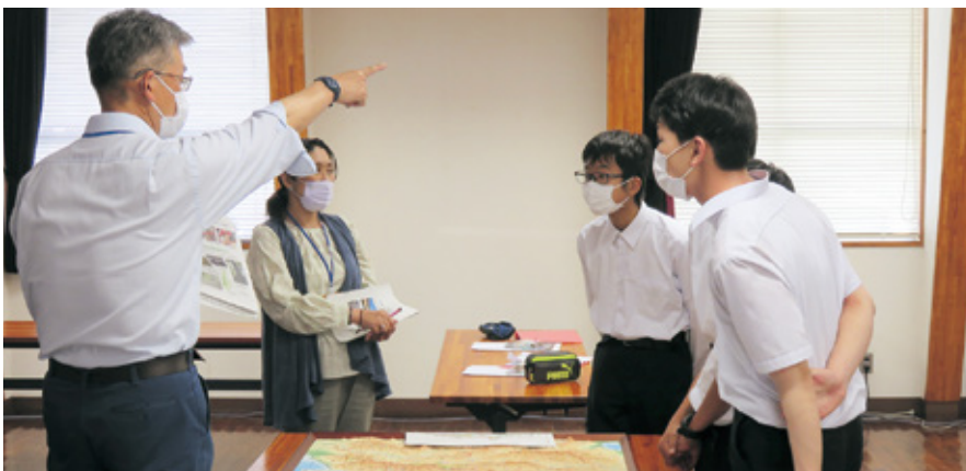
国有林のことを学ぶ生徒たち

一時間半という短い時間でしたが、今回の体験を生かして、生徒たちがどのように考え、行動し、どういう大人に成長していくのか、当署の職員としてだけではない、人生の先輩としてエールを送ることができ、森林づくりは、人づくりにもなると思われました。