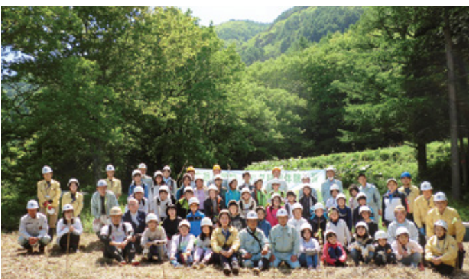
5月23日 キハダ植樹体験学習 (木祖小学校5・6年生の子ども達とともに)

企業の皆様と社員で苗木九百本を植樹しました。更に今年初めての取り組みとして、木祖村立木祖小学校の五、六年生三十六人とキハダ植樹体験学習を行いました。未来を担う子ども達が、木曾の自然の恵みや、薬草を用いる先人の知恵を知り、未来へつなぐ一助となればと願っています。当日は子ども達と苗木一〇〇本を植樹しました。