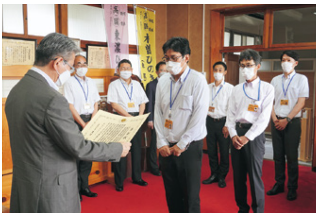
上局長から表彰状を受け取る治山課の職員

広報「中部の森林」197号の「お役に立ちます国有林」、213号の「特集 現地検討会」でご紹介した『独立基礎型流木捕捉工』について、取組が今年度の優良職員表彰として林野庁長官賞を受賞しました！