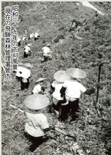
昭和三十九年の下刈風景 (現在の飛騨森林管理署管内)

植栽した苗木の成長が妨げられないように雑草木を刈り払う作業が下刈りです。植栽してから数年間、毎年、夏季に行われる作業ですが、暑い中での作業になることも多いため、林業の中でも最もつらい作業だと言われています。