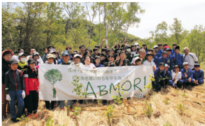
ABMORI・作業後の記念写真

五月二十八日、長野市の茶臼山自然植物園にて、長野県植樹祭(長野会場)・長野地域森林祭が開催されました。