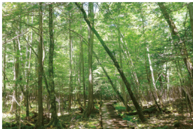
段戸裏谷原生林内の自然観察路

常緑針葉樹と、ブナ、ミズナラなどの落葉広葉樹が共生する天然林であるため、毎年多くの人たちが自然観察などに訪れ、賑わっています。