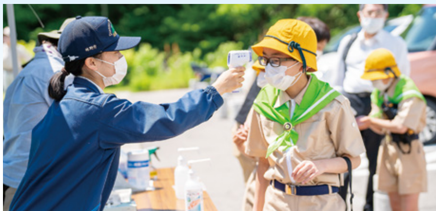
植樹祭スタッフとして、参加者の体調を確認

新型コロナウイルス感染症による中止も予想される中、規模の縮小や検温、消毒等の感染症対策を行いながら実施された三箇所での植樹祭でしたが、当署の職員は植樹祭のスタッフや植樹リーダーとして、各地域や団体のみなさまとともに汗を流し、地域の緑化と森林資源の整備に取り組みました。