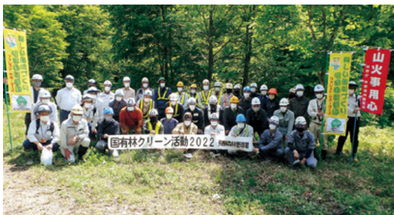
クリーン活動後の記念撮影