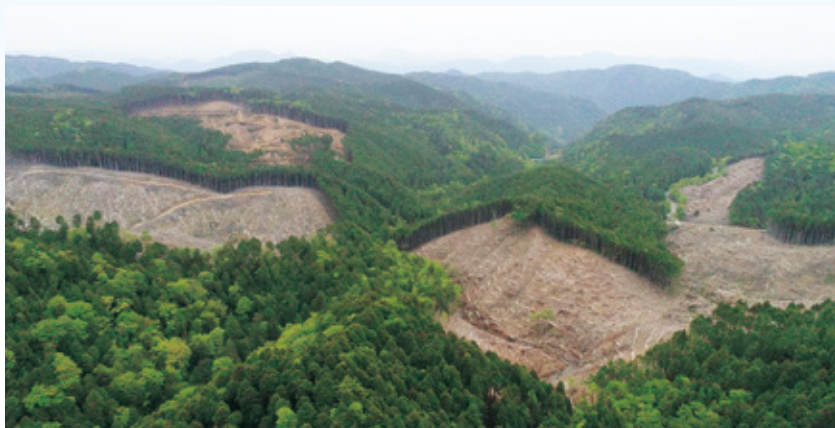
人工林がほとんどを占める段戸国有林

国有林の現場の最前線で、働く森林官の仕事や、管轄する地域の特色などを紹介します。