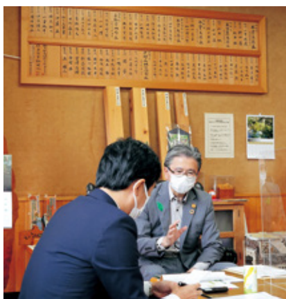
インタビュー取材 (R4.5.27:局長室)

とが非常に大切になると考えております。 本誌をはじめ様々なツールを使って中部局の取組を発信しておりますが、引き続き国有林野の管理経営にご理解を賜りますようお願い致します。