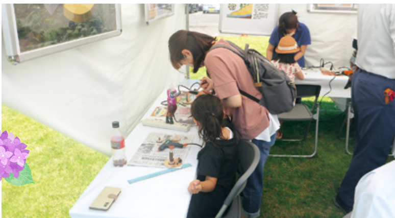
親子で木工作品を製作する様子

まめに水分や塩分を摂るなど、熱中症対策をしながら祭典を盛り上げました。 二日連続となる木工教室でしたが、その準備や当日の対応に、富山署職員一丸となって取り組み、多くのお客様のマスク越しの笑顔を見ることができました。