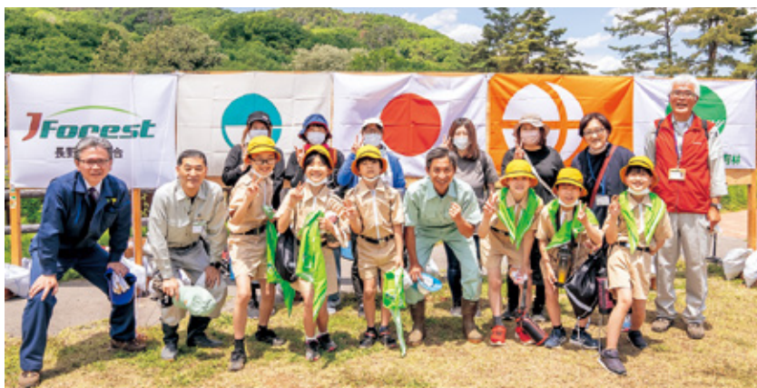
令和4年度長野県植樹祭・長野地域森林祭 (R4.5.28): 一番左が局長

最後に、県及び市町村、関係する法人・会社、並びに本誌を読んでくださっている方々に1年間の御礼を申し上げるとともに、皆様の益々のご発展とご健勝を祈念致します。退任の挨拶とさせていただきます。誠にありがとうございました。