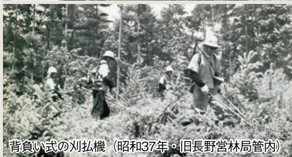
背負い式の刈払機 (昭和37年・旧長野営林局管内)

刈払機が使われ出すようになってもお、大鎌を使った作業は続きました。これは急斜面や太い雑草木の箇所など、大鎌で行った方が効率的な現場もあったからです。木の伐採や運搬は林業の機械化とともに大きく効率が上がりましたが、下刈りなどの造林作業をより効率化することは現代でもなお課題となっています。