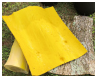
キハダから採取した生薬「オウバク」

百草・百草丸の主成分は、ミカン科の落葉高木キハダの周皮を除いた樹皮である生薬「オウバク」です。これらの生薬製剤をつくり続け、未来へ継承するため、キハダは欠かせないものです。信州木曾の豊かな自然と風土の中でキハダを大切に育て、将来の薬づくりに生かし、多くの方々へ健康長寿にお役立ていただきたいとの願いを込めて、キハダの植樹を行っています。