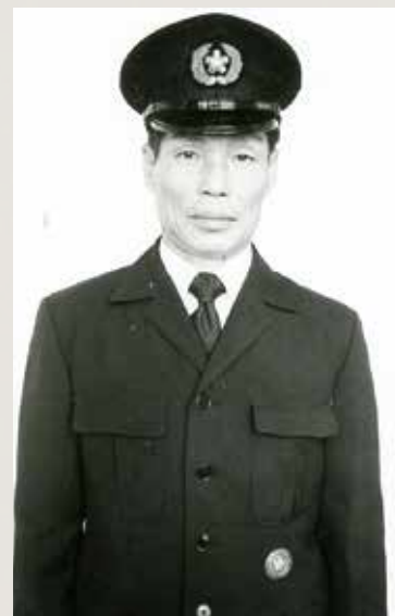
昭和25年に制定された 第一種制服

林は大きく分けて農林省山林局、宮内省帝室林野局、内務省北海道庁という三つの別々の組織が所管していました。