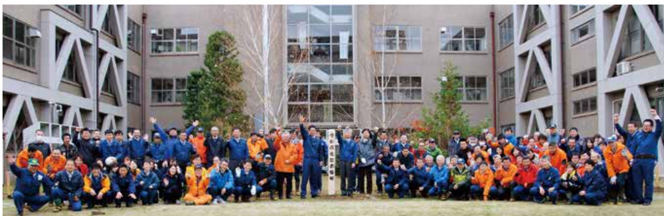
令和改元記念植樹 (R元.11.25：中部局庁舎)：中央標柱左側が局長