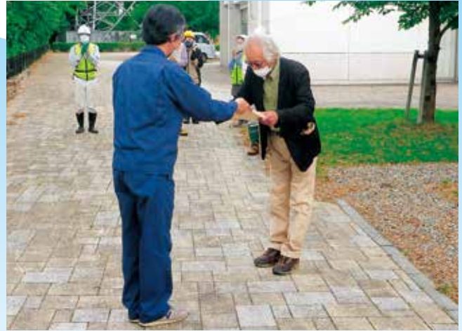
林野庁長官感謝状の贈呈の様子