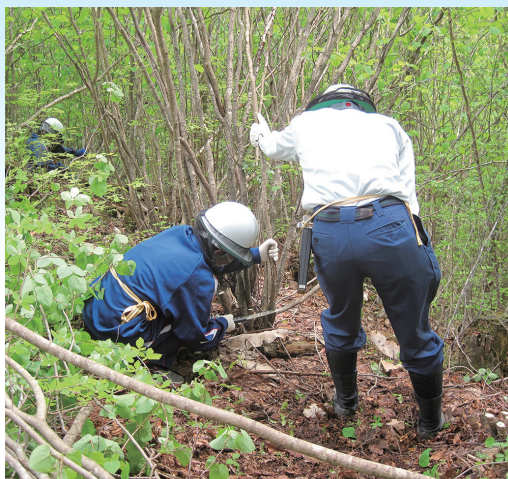
灌木などを鋸で切っている様子(上下)