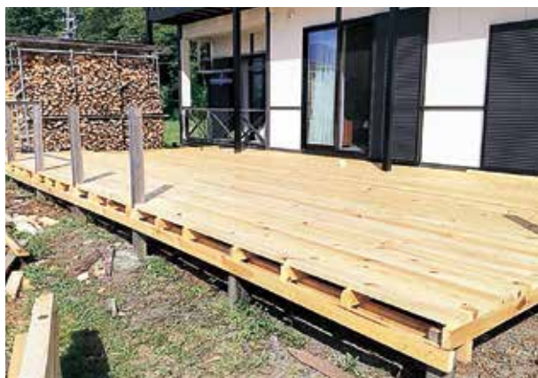
地域のアカマツでDIYした大型ウッドデッキ

薪の仕事をしていた時です。太い立派なアカマツの丸太が薪材です。もったいないし、薪にするのも大変だし、なんとかならんかな。どうして木材として使えないのかと素材に疑問に思っていました。