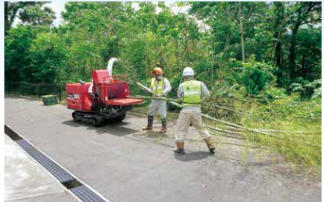
チップーにより竹を粉碎している様子