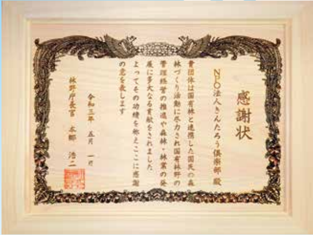
受賞者に贈られた木製の感謝状