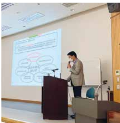
局職員による講義

また、諏訪南森林事務所奥山森林官からは、「山の状況・変化を見て、森林の機能を發揮するために必要なことを考え、行動する」