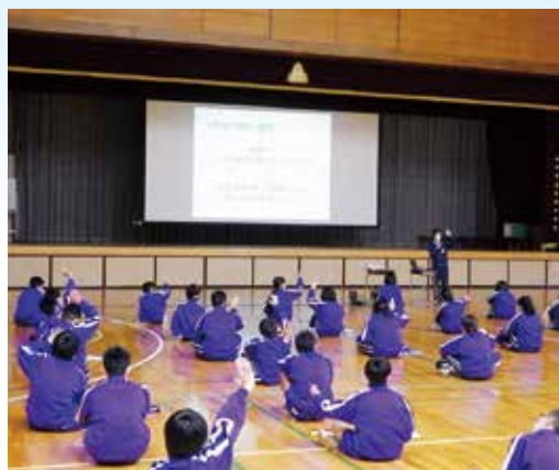
森林の働きについての学習の様子

次に、ふれあい担当から森林の働きについて、また、その働きを發揮させるためには適切な管理・手入れが必要であること、さらに、東濃ひのきや木曾ヒノキ備林など付知町の森林の魅力について伝えました。