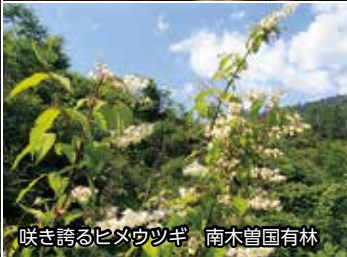
咲き誇るヒメウツギ 南木曾国有林