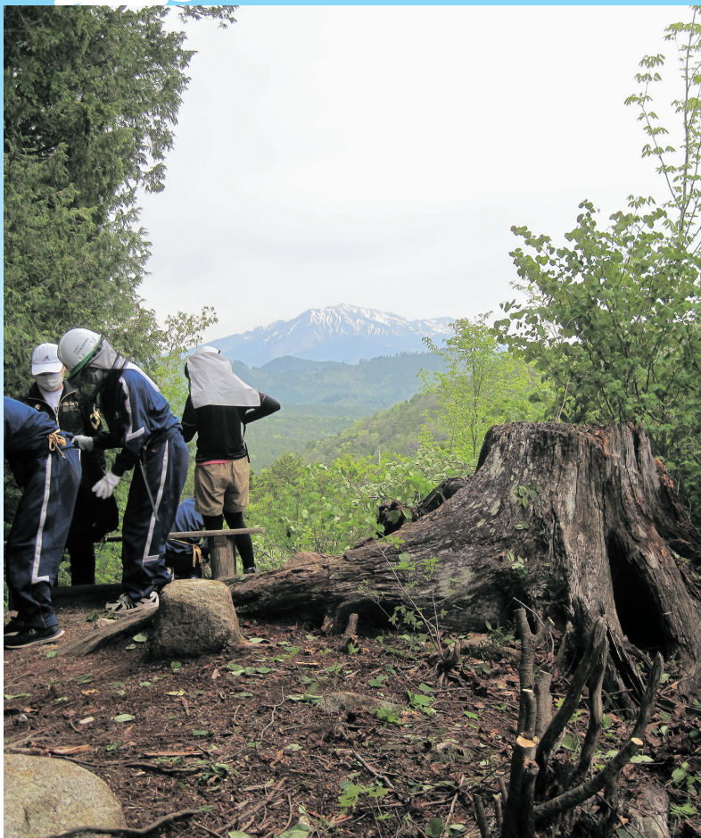
作業後、赤沢台からの御嶽山の展望

木を切るときに使用する、鋸を初めて使用する生徒が多数だったことから、作業開始直後はぎこちない様子で苦戦する場面も多くありましたが、終盤には手慣れた様子で作業を進めていきました。