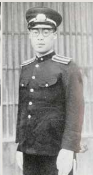
昭和20年代初頭の営林署 (農林省山林局) 職員