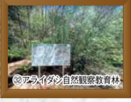
㉜アライダシ自然観察教育林

※ 案内へ行く場合は、登山と同様、自己責任が原則です。入林等の手続が必要となる場合や林道等を行う必要があります。事前に東濃森林管理署までご確認ください。