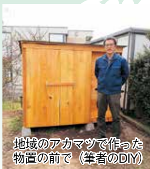
地域のアカマツで作った物置の前で (筆者のDIY)