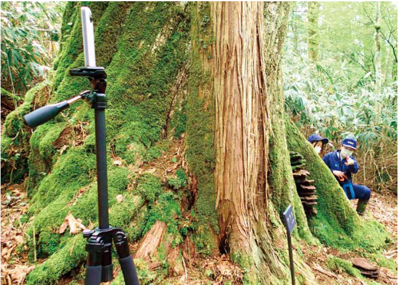
遠隔操作で360度撮影している様子（アライダン自然観察教育林内の共生木）