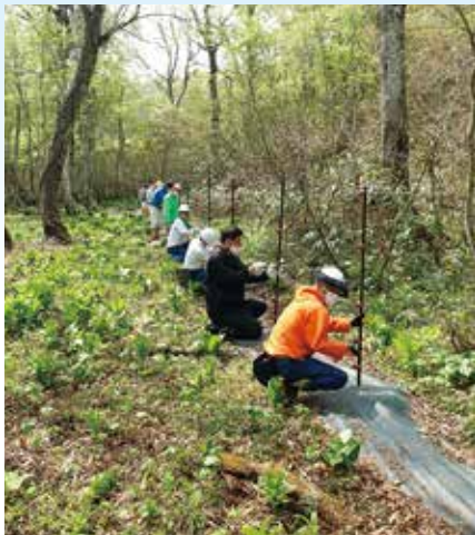
電気柵設置作業の様子2