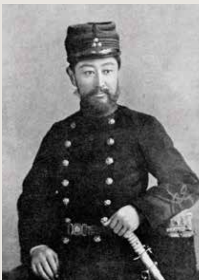
明治30年代の小林区署長 (※撮影地域・個人等不明)

「昔の軍人さんの写真?」と、思われる方もいらっしやるかもしれません。これは明治三十年代の「小林区署長」、今で言う森林管理署長さんの制服(正装)です。サーベルも持っていたりと、戦前の制服は大変厳めしいものでした。