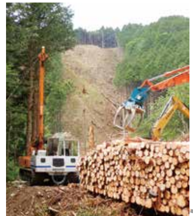
タワーヤードによる集材作業

各業務の実行にあたっては、足下の確認、足場の確保とともに、ゆとりを持った行動に努め安全を確保しているところです。このことについては、各請負事業の監督時にも繰り返し指導しているところであり、今年度の全ての事業が無事故・無災害で終了するよう業務を進めていきたいと思っています。