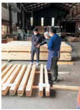
地域の有賀製材所さんをお借りして 地域木材の販売会

そこで、地域材を地域の人がDIYで使う仕組みを作ろうと活動を開始。地域材を販売するイベントを定期的に開催しています。知名度も無く、誰も来てくれないかと思いきや、イベントは盛況。地域の木材を使いたいというニーズは確実にあると感じています。