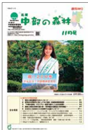
創刊200回記念号表紙 (R2.11月発刊)

読者の皆様におかれましては、引き続き、森林・林業・木材産業へのご理解、ご協力とともに、「中部の森林」のご愛読、そして中部森林管理局への応援をお願い申し上げます。一年九ヶ月、本当にお世話になり有り難うございました。