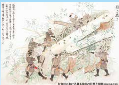
林業の歴史を説明するスライドのひとコマ

この森林教室は付知町優良材生産研究会により次代を担う子ども達に森林の大切さを伝えるために座学、木工教室、育林作業、木曾ヒノキ備林の見学という内容で年四回にわたって実施されます。最初に当署長から、日本の林業の歴史について木曾式伐木運材図会や木曾川の筏流し、森林鉄道の映像を用いて説明しました。