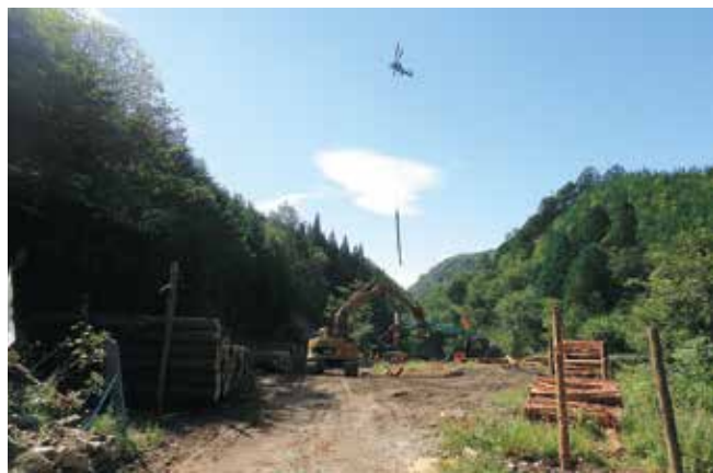
ヘリによる集材作業

また、部内は地形が急峻であることから、滑り等に起因する滑落が心配されるところです。