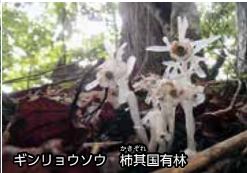
ギンリョウソウ 柿其国有林