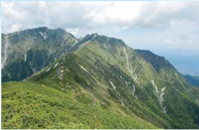
越百山から仙涯嶺と南駒ヶ岳を望む