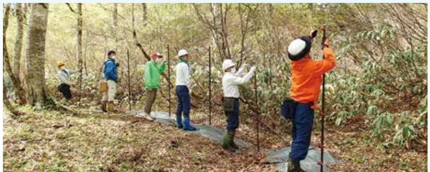
電気柵設置作業の様子1