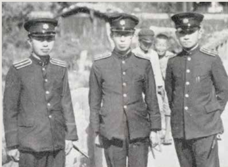
昭和20年代初頭の帝室林野局 (宮内省) 職員

職員の制服は時代や役職、所属する組織によっても違いました。現在の「林野庁」に繋がる「林野局」が出来る昭和二十二年以前、国有