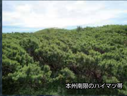
本州南限のハイマツ帯