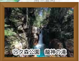
㉕夕森公園 龍神の滝