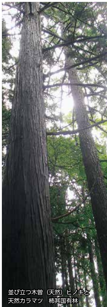
並び立つ木曾(天然)ヒノキと天然カラマツ 柿其国有林