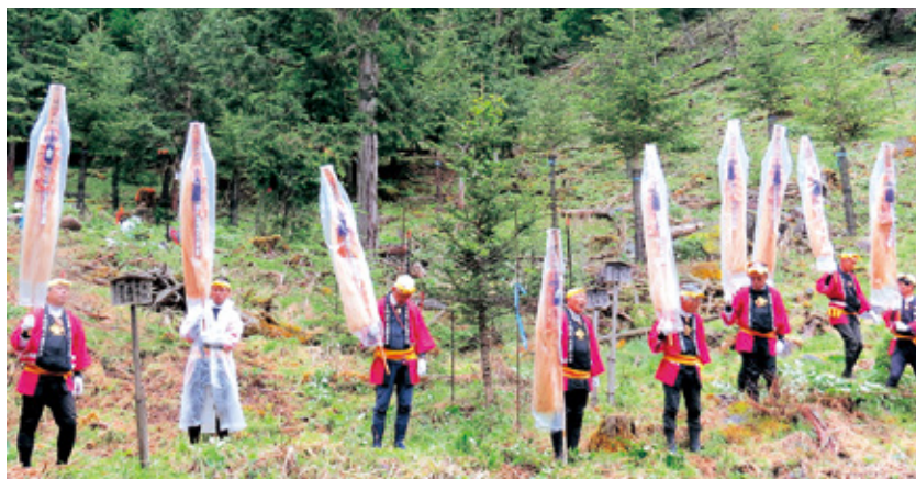
木遣り保存会の木遣り披露

また、下諏訪町の木遣り保存会による木遣りが披露され、「立派な大木になり将来の御柱になるように！」との願いを込め一本一本丁寧に植樹し、ニホンジカからの食害を防ぐため、モミの木を防鹿ネットで囲み、諏訪地方の伝統的な諏訪大社下社の御柱祭で使用可能なモミ大径材を育てるため作業を終えました。