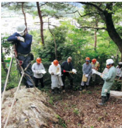
見学会の様子と背景の市街地

この地区では、平成二十六年から鋼製のワイヤーによるロープネット工等の落石対策工を実施し、今年度完成見込みとなっております。近年全国各地で甚大な自然災害が頻発する中、この現場の直下にお住まいの方々に治山工事への理解を深めてもらうことを目的として、工事の状況を見ていただきました。