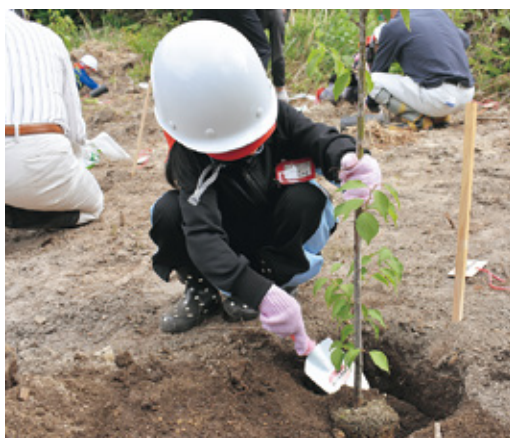
苗木を丁寧に植えています

この植樹祭は「緑の募金公募事業」の対象事業として実施したもので、一人一本「梅」の苗を植え、苗に自分の名前を書いたプレートを付け、獣害防止ネットをかぶせて完了です。