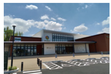
しだみ古墳群ミュージアム