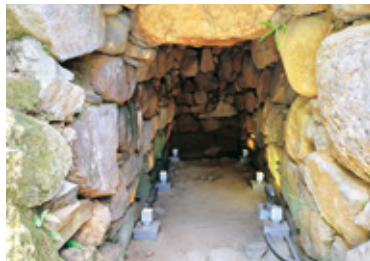
東谷山白鳥古墳 石室