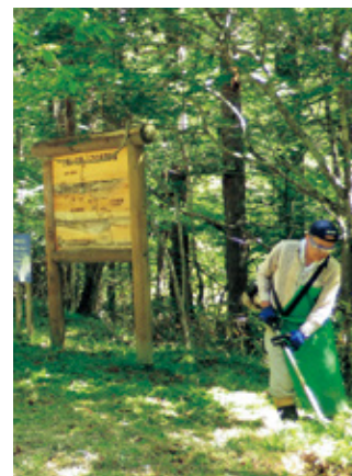
草刈り作業の様子

この「ゴミゼロ運動」は、国民の皆さんが森林に触れあう場の環境を整えるとともに、不法投棄防止等啓発活動として行っているもので、ゴミの量は年々減少してお