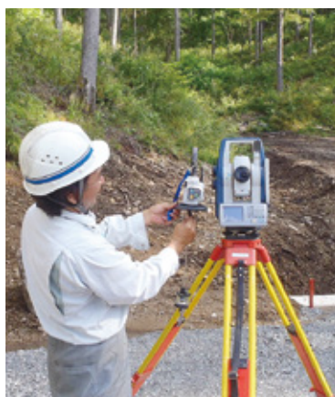
測量作業中の筆者

入職したきっかけは、父が建設 業で働いており、年少期から建設 工事の現場を見る機会に恵まれた こと、工作の授業では、木材など を使った「モノ造り」に興味を持 つようになり、将来は自分の手で 何かを作り上げたいとの気持ちか