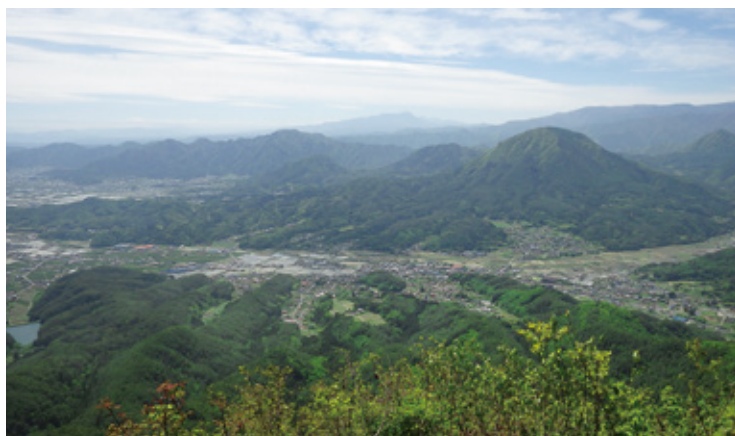
子檀嶺岳山頂から青木村を望む

国国有林と言えば現場、現場と言えば 森林官！しかし、一般の方には余り馴 染みがないと思います。 そこで各地にある森林事務所や地域 の特色、森林官の仕事などを紹介して いきます。