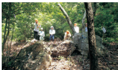
完成したロープネット工

名の住民の方に参加いただき、国有林野の取組、治山事業と山地災害危険地区について説明し、受注者である今泉建設（株）の協力で、巨石をワイヤーロープネットで覆うためのアンカーの削孔作業の説明を受けながら見学しました。参加者からは、「普段なかなか見ることができない工事を見学できて良い機会になった」、「転石があることは知っていたが、こんなに大きな岩が沢山あるとは思わなかった」、「転石がワイヤーロープで固定され安心であり頼もしく感じる」、「災害防止に向けて工事を実施してもらい感謝する」、「今回の見学会に参加し、国有林・愛知森林管理事務所を身近に感じられるようになった」など、災害に対する関心の高さがうかがえ、住民の方々とのつながりができた有意義な見学会となりました。