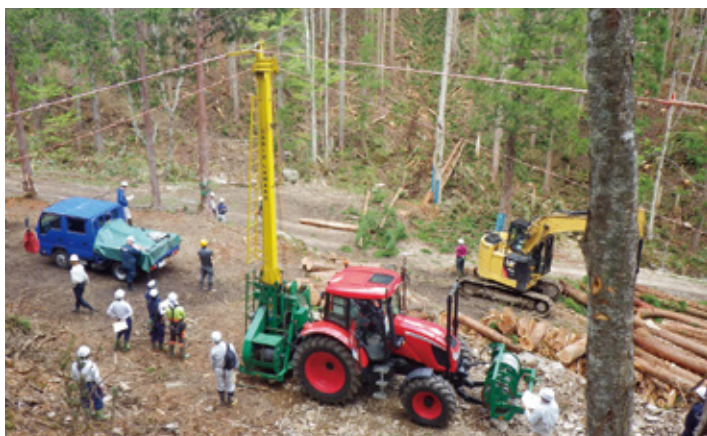
トラクター搭載型タワーヤードの実演見学の様子

今後も、国有林のフィールドを活用し、技術・知識の普及、情報交換など民国連携による森林づくりを推進していきたいと考えています。