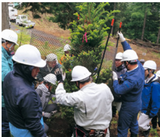
防鹿ネットで縦を守る

開催にあたり、主催者を代表して下諏訪町長から、「伝統ある諏訪の御柱を子や孫につなげるため百年、二百年先を見据え、立派な森として守り育てていくことが大切」と挨拶がありました。