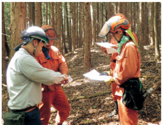
請負事業者との打ち合わせ（左が筆者）

■未来の担い手へのメッセージ 私は、これまで中部森林管理局 管内において、愛知県を除く長野 県、富山県、岐阜県の森林管理署 で勤務した経験があります。それ ぞれの地域により人柄、考え方が 全く違い、植生や地形も実に多種 多様であり、いろいろな経験がで きました。その中でも、国国有林の 造林地の中を歩き、諸先輩方が何 を思い、この造林地を作ったのか などを想像しながら、見晴らしの 良いところで食べるおにぎりは、 どんな高級料理よりもおいしく感 じることができ、一度は味わって いただきたい最高の経験です。