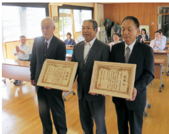
林野庁長官感謝状を報道に披露する

た。捕獲頭数は予想をはるかに上回った。また、空振りが無いので猟友会員の負担軽減につながった。大変光栄な賞状をいただき感謝申し上げます」また、宮下建設（株）の代表取締役からは「社員の業務負担にならない中で協力をさせていただいた。正直、予想以上の捕獲頭数に驚いた。少しでも二ホンジカが減少し森林環境が向上すればありがたい。今後とも協力していきたい」とお礼の挨拶がありました。