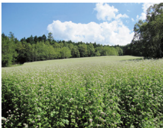
国国有林の中で育つタチアカネ

スも複数整備されており、山頂ま で二時間程度であるため、日頃の 運動不足解消にも適しています。 青木村の名産品に「タチアカネ 蕎麦」があります。タチアカネは 青木村のオリジナルブランドであ り、平成二十一年に農林認定品種 に指定された新しい品種であり、 国国有林の中でも栽培されていま す。白い花と赤い果実、味はさわ やかな香りとほのかな甘み特徴 であり、運動後の腹持ちには最高 です。「道の駅あおき」のほか、 村内の多くの蕎麦屋で食べるこ ができますので是非味わってみ てください。