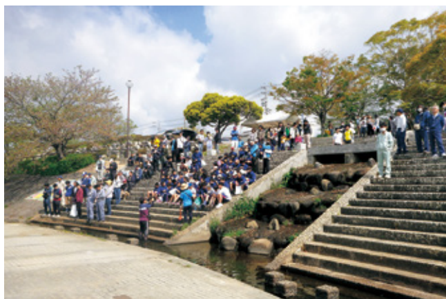
環境整備のために集まった皆さん