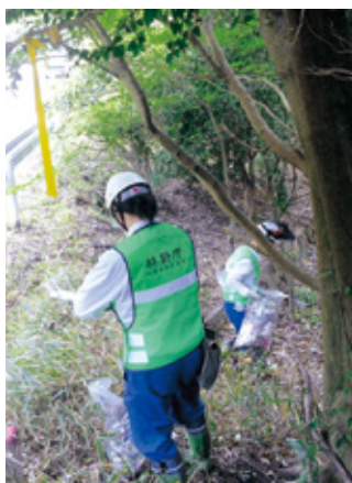
ゴミを収集する職員