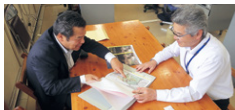
自治体担当者への情報提供

この課題に対する取組として、当所では六月上・中旬にかけて、管轄している「山地災害危険地区」の関連情報について、飯田市など関係自治体十市町村の林務及び防災担当者に対し、関係資料を手交するとともに、地域住民等に対する防災意識の高揚に資するよう趣旨の説明などを行いました。