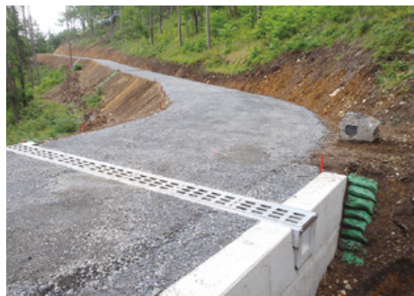
完成した林業専用道

五〇〇坪の林業専用道新設工事を 施工しました。 ■現場での役割、魅力 現場では、工程・品質・安全・ 原価等の管理があり、軟弱土質と いう現場条件のために不整地運搬 車を導入、効率的な出来形管理の ためにTS測定器を使用、路床支 持力の確認にデジタル簡易支持力 測定器を導入するなど、創意工夫 することができました。 後に「自分が施工した現場」と 家族・友達に言える時は、達成感