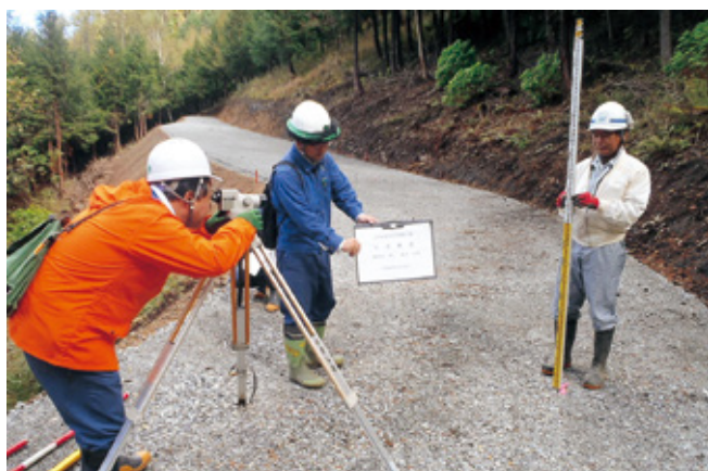
出来形検査 (右が筆者)

があります。 今回、当該工事の現場代理人と して林野庁長官賞をいただきました。 前年の四方原林業専用道新設工 事での農林水産大臣賞に続き、二 年連続の名誉ある賞を受賞いたし ました。森林土木工事は、個人的 にも評価されるということでも魅 力的でもあり、やりがいを感じま す。 ■林業土木の仕事に 入ったきっかけ