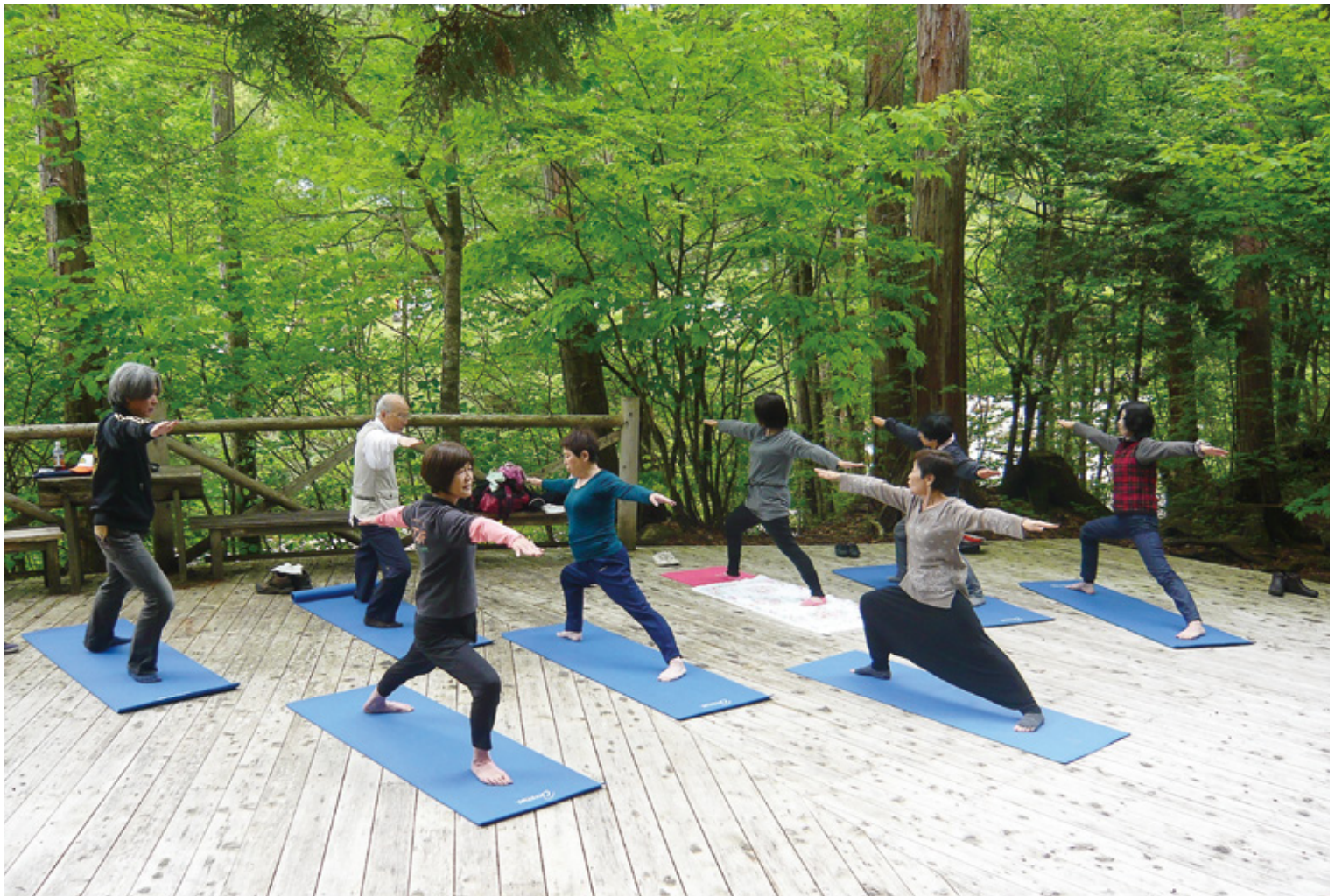
6月の見どころ聴きどころ⑰「第21回森林セラピーウォーク～緑の空気でカラダよろこぶ～」 (一般社団法人 木曾ひのきっ子ゆうゆうクラブ様からの投稿)