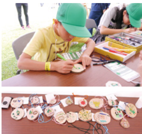
ペンダント作り体験の様子

その中には、中部森林管理局が出展したブースもあり、PR看板やお山ん画を展示するとともに、参加された方々による記念のペンダント作りを体験していただきました。