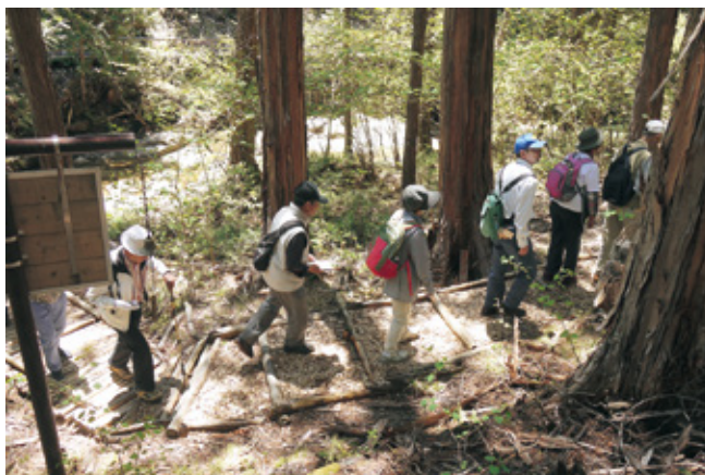
散策を楽しむ参加者

史や運材方法、伊勢神宮との関わり、木曾五木の見分け方や特徴などを学びながら、約二時間の森林散策を満喫しました。