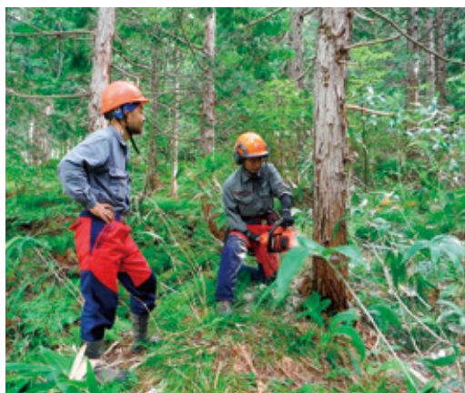
指導を受けながらの伐倒作業

まだ一年目ということもあり、現場では主に間伐作業等で伐倒を担当していますが、地拵え・植栽等の造林作業も経験しました。学校で学んだことは役立っています。が、その場その場で適切な判断を求められることが多く、伐倒では、ただ倒しやすい方向を選ぶのではなく、集材しやすい位置に伐倒することを考え、どうやったら