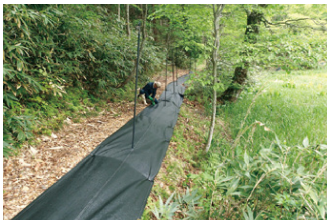
防草シートの張り替え作業

本作業では、岐阜大学の学生十五名の参加もあり、電気柵の設置のほか、昨年の暴風により壊された防草シートの張り替え等がスムーズに進みました。