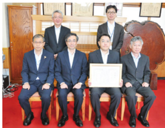
感謝状贈呈式後の局幹部との記念撮影

また、贈呈式終了後、立澤設計指導官による報告会を開催し、局職員約九十名が参加しました。