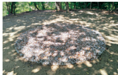
白鳥塚古墳 後円部頂部