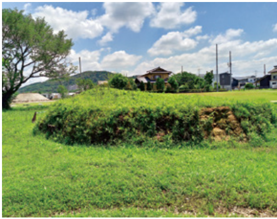
東谷山と大塚3号墳

大阪の「百舌鳥・古市古墳群」が世界遺産への登録を勧告されるなど、近頃古墳が注目を集めています。 名古屋市内にも約二百基の古墳が確認されており、最も集中しているのが名古屋市北東部の「志段味古墳群」です。 志段味古墳群は、名古屋市の最高峰「東谷山」とつながりをもつ