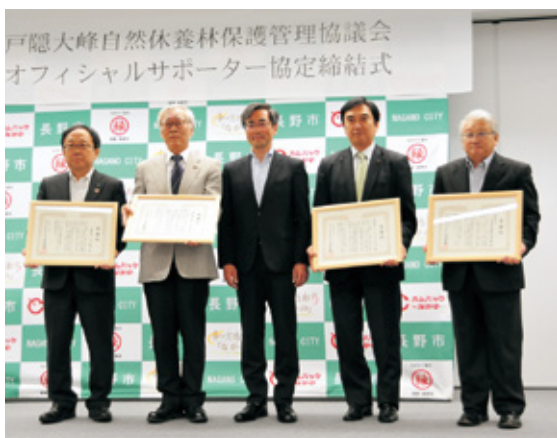
感謝状贈呈後の記念撮影

この選定を受け、施設の維持管理に対し、資金や資材、労力面で民間企業等からの支援をお願いしたところ、(株)コシイプレザービング(大阪市)と(一財)日本森林林業振興会長野支部からは「資材の提供」、長野林業土木協会北信分会からは「労力の提供」、(株)八十二銀行からは「資