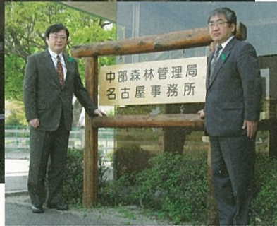
上：新たに設置された名古屋事務所 右：新しい看板を披露する関局長（右）と山崎次長