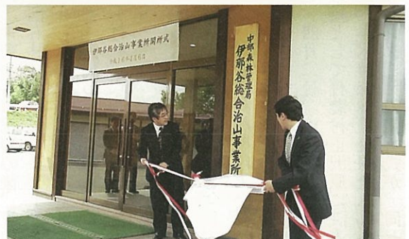
看板の除幕式を行う関局長と石田所長

国有林野事業における抜本的改革の集中改革期間が終了し、平成十六年四月一日より、新たな体制による中部森林管理局が発足しました。 これに併せて、円滑な地元対応等を目的に「名古屋事務所」が新たに設置されました。 また、NPO等との連携をはじめ新たなニーズにこたえるべく「木曽森林環境保全ふれあいセンター」が日義村に、さらに、災害の歴史を有する地域の国土保全を行うべく「伊那谷総合治山事業所」が飯田市に新設され、名実ともに「国民の森林」国有林を目指して、新しい中部森林管理局がスタートしました。