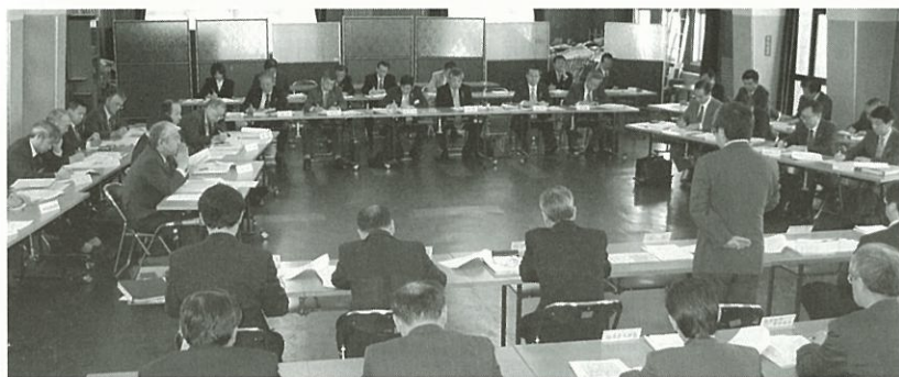
署長等会議の様子 (大会議室)