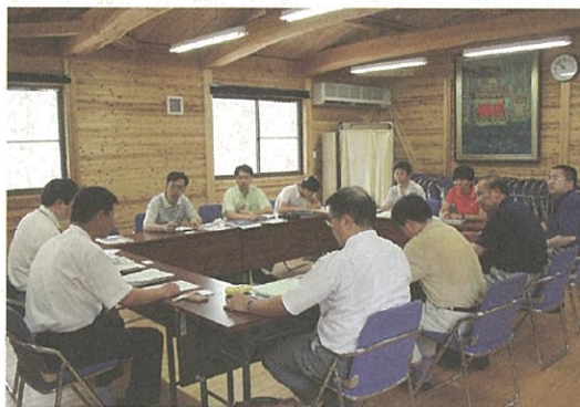
熱心に聴講する中国の研修生

当日は、名古屋でもことのほか暑い一日となりましたが、八名の研修生は、造林事業分野、林業行政分野のエキスパートとして熱心に聴講され、活発な質問に予定時間を超えてしまうほど内容のある研修となりました。