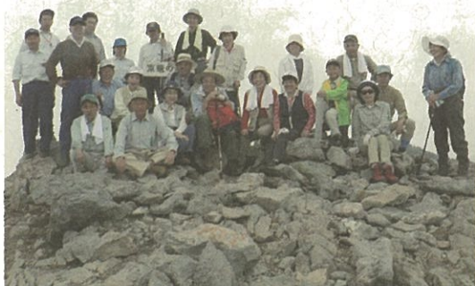
東籠ノ塔山頂にて

参加者は、高山植物の花が咲き競う中、当署職員から説明を受けながら、周囲の樹木などを興味深く見て歩く中で、「このような機会がないとふれあいの郷にある樹木や草花の名前もわからなかった。これからは興味を持って接することが出来ます。」等の喜びの声が聞かれ、次回再会することを誓い合っていました。