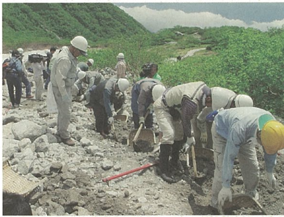
一生懸命に土砂の除去作業

作業場所となった水路は、平成十一年度に、当時の駒ヶ根森林管理センターが設置したもので、昨年の度重なる台風の襲来により一部が埋まってしまい、あふ