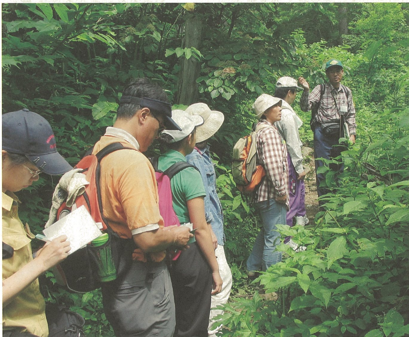
熱心に説明を聞く教職員