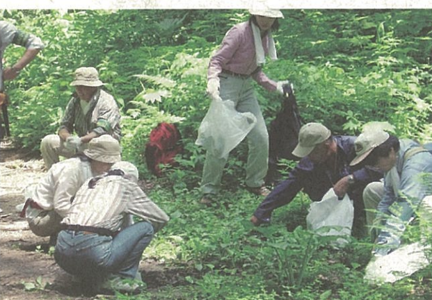
オオバコの除去作業の様子

帰りは疲れた足取りではありませんでしたが満足した様子で、それぞれオオバコを入れた大きな袋を両手に持って下山しました。