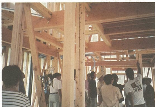
建築中の第四号八木邸

立方メートル（木材使用量の約八割）を使用しています。M邸は古民家再生で古材、新材が入り交じり、時代を感じさせながらも現代に見事に調和した趣ある建物に生まれ変わります。 その後、木曾署上松土場で、「木曾のヒノキの家」で使用されるヒノキ等を見学し、一号邸である日義村の中邸を見学し帰途につきました。