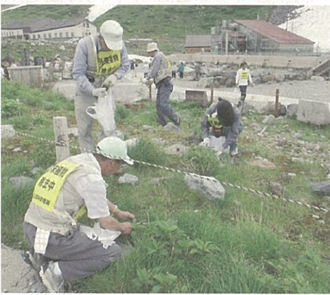
移入植物の除去の様子

室堂平では、チングルマやイワカガミ等が咲くなかでセイヨウタンポポ等の除去を行っている観光客から「ご苦労さま」との声をいただき、気持ちも新たに熱心に作業は続き、当日の作業でセイヨウタンポポやシロツメクサ等約千五百株を除去しました。