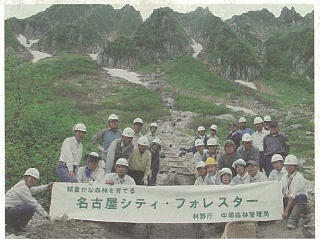
作業を終えて記念写真