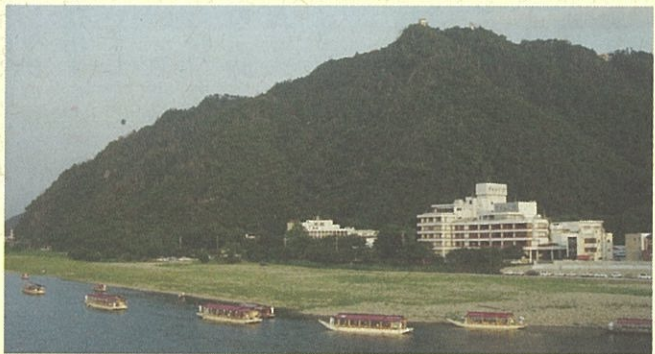
長良川からのぞむ金華山

山頂を目指したいくつもの登山道があり、岐阜市の中心近くにあることからビギナーから健脚者まで多くの市民に親しまれています。 また、昆虫、野鳥の宝庫でもあり、貴重な自然を生かし、森林教室、職場体験学習など自然観察が盛んに行われています。 アクセス JR岐阜駅から岐阜公園前バス停下車 ロープウェイで三分、徒歩七分で頂上