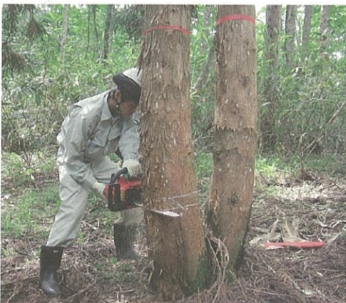
緊張して間伐作業

実習終了後の感想を兼ねた挨拶では、「学校では習わないいろんな体験ができて良かった。これらの体験を、今後の学校生活や人生に生かしていきたい。公務員試験を頑張りたい。」との声が聞かれました。