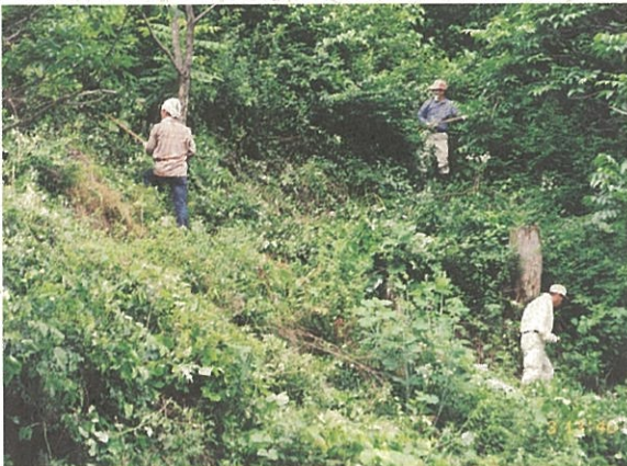
下刈り作業の様子

当日は塩尻市との合併初年度であることから、市職員も初めて参加し、組合員・支所職員・木曾高等漆芸学院訓練生等、約三十名が参加して急斜面での作業に大粒の汗を流しました。