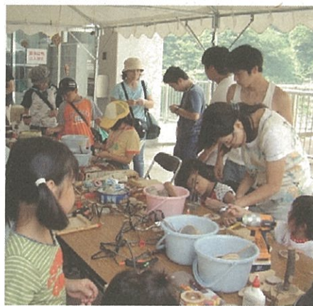
子供も大人も一生懸命に

当署としても、子供たちがうれしそうに木とふれあい、自然と親しむ姿を見て今後もクラフト教室を継続したいと考えております。