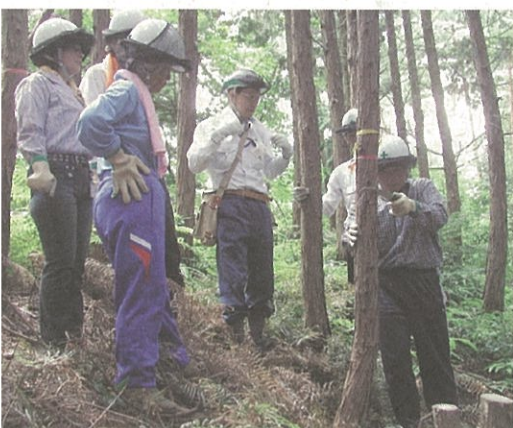
間伐作業を真剣に

二日間とも暑い中での研修会でしたが、参加された方々からは、「充実した内容だった」、「学校での野外活動に取り入れていきたい」、「地球温暖化防止の観点からも林業の大切さが分かった。」などの声が聞かれました。