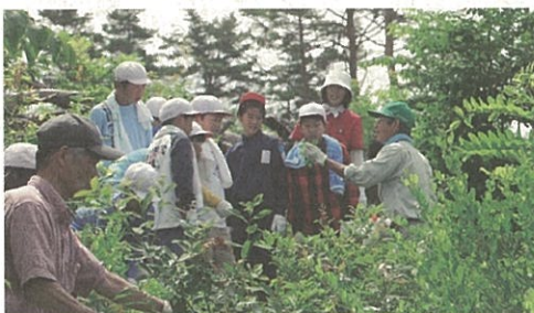
下刈体験で指導を受ける児童たち

数日後、児童たちから、感想文が署に届きました。感想文から、「山火事でのくらい焼けたか聞いてびっくりした。」「山に自然が戻るのは何十年後だけど、低学年も下刈作業を引き継いで元の山になってくれればうれしい。」「初めてだったけど、鎌を斜めに引く張るとスパッと切れて楽しかった。」「草がボーボー生えていて大変だと思ったけれど、みんなできると頑張ってやることとて、もきれいにすることがわかった。」「など、児童たちが真剣に体験学習してくれ、ことが伺えました。