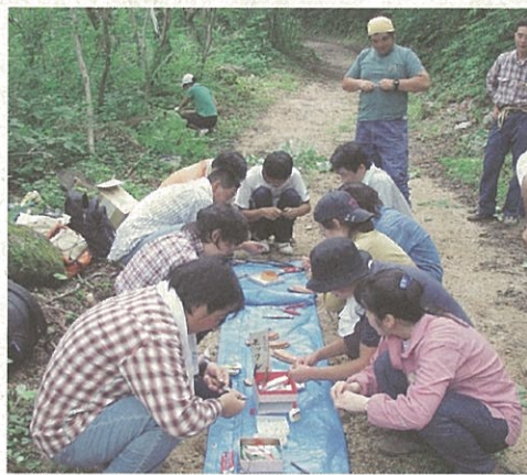
木工クラフト体験を夢中になって

参加した教職員からは、「木を植えるだけでなく、木を伐ることの大切さ、間伐材の利用法を考える良い機会となった。子供達にこれから森の大切さ、楽しさを知らせていけたらと思います。」、「もっと森や林で生徒が夢中になる活動も教えて頂きたいと思いました。」との意見がありました。