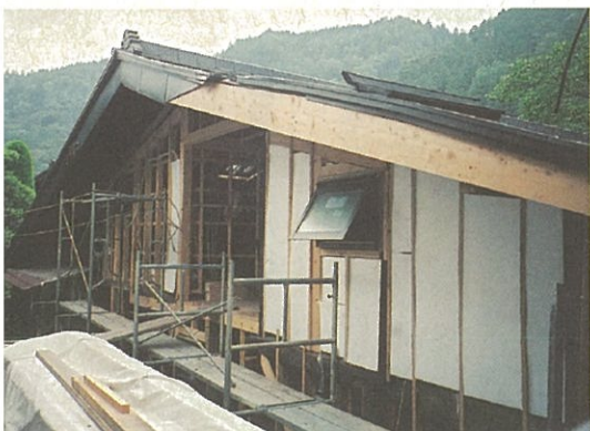
古民家再生中の第五号M邸