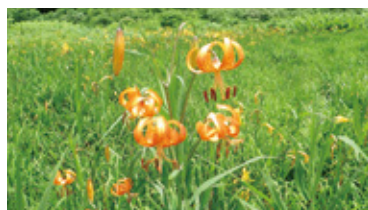
ジャコウソウ(上) コオニユリ(下)