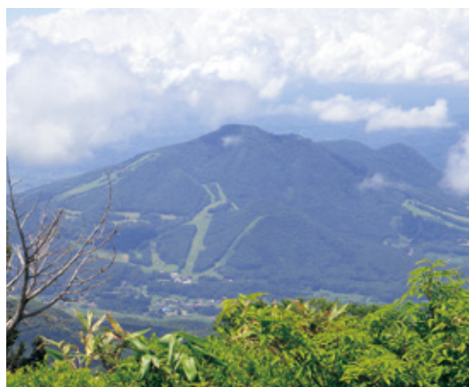
高標山山頂から高社山を望む

所在地(総合案内所) 長野県下高井郡木島平村大字上木島木島山国有林内(営業期間:六月上旬~十一月上旬)電話:〇九〇八〇二五四二八八 ◆アクセス 【公共交通】JR飯山駅からタクシーで五十分。また、期間中は「カヤの平高原・秋山郷秘境シャトル便」ツアーがあります。お問合せ:信越自然郷飯山駅観光案内所 電話:〇二六九一六二七〇〇 【自動車】上信越自動車道・豊田飯山ICから車で六十分