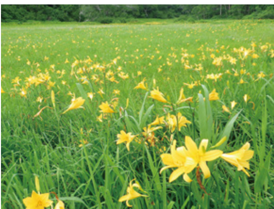
北ドブ湿原のニッコウキスゲの群落