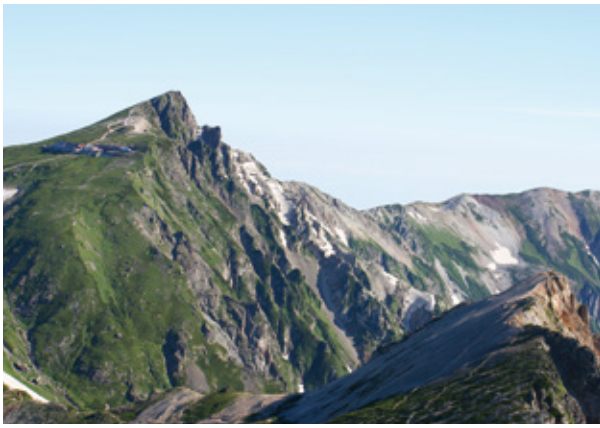
鐘ヶ岳山頂より白馬岳を望む

長野県と富山県の県境に位置する白馬三山は、白馬岳・杓子岳・鐘ヶ岳（槍ヶ岳と区別するため、白馬鐘ヶ岳とも呼ばれています）の三つの山の総称で北アルプスの一角に位置し、いずれも三千以上の名峰ぞろいです。