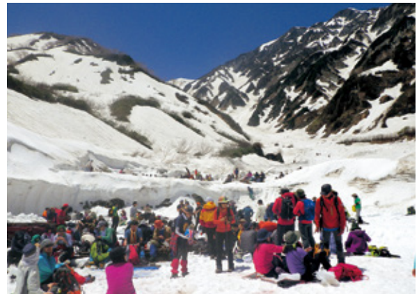
大雪渓へ向かう登山者（令和元年5月 開山祭）

特に、白馬岳は、大雪渓と高山植物が豊富な花の名山として、例年、国内外から多くの登山者が訪れています。