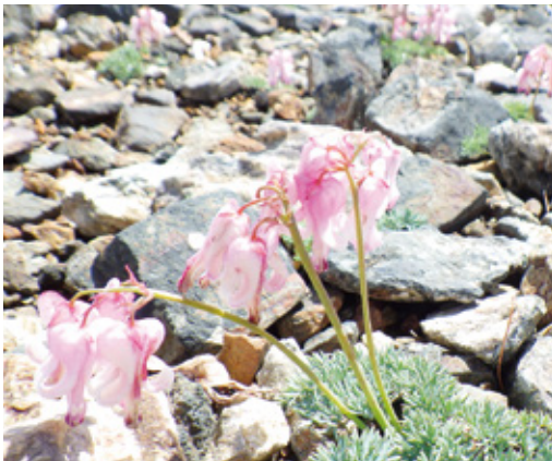
高山植物の女王、白馬岳のコマクサ

特に、白馬岳は、大雪渓と高山植物が豊富な花の名山として、例年、国内外から多くの登山者が訪れています。