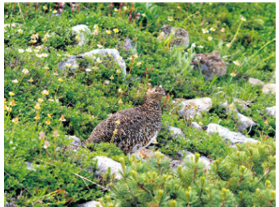
お花畑とライチョウ

白馬の由来は、春になると雪が解けた山肌に黒い「代掻き馬」の雪形が浮かび上がることから、代掻き馬が代馬（しろうま）となり、「白馬」という名前に転じたといわれ、ふもとの農家では、この代掻き馬が現れると田んぼの代掻きを始める農事暦になっていた。